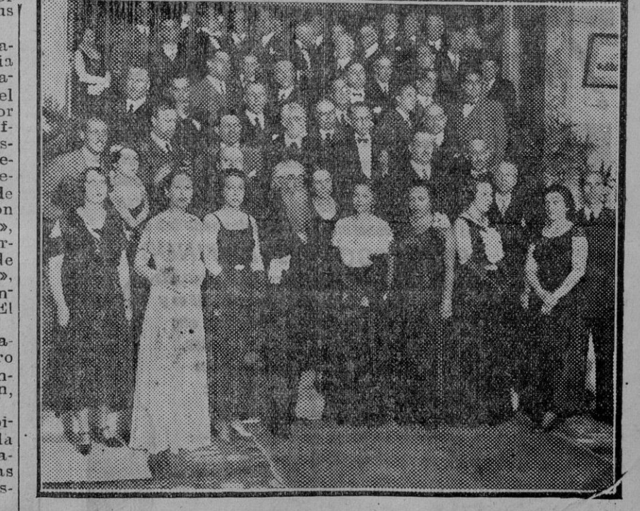
Don Ramón del Valle Inclán, que ha sido objeto de un cariñoso homenaje por el éxito alcanzado en sus últimas producciones «El tirano Banderas» y «El ruedo ibérico», y por último, por haber sido elevado a la presidencia del Ateneo, aparece en nuestra fotografía rodeado de algunos de los concurrentes al banquete, entre los que se encuentran los más significativos valores de las letras españolas de uno y otro sexo.