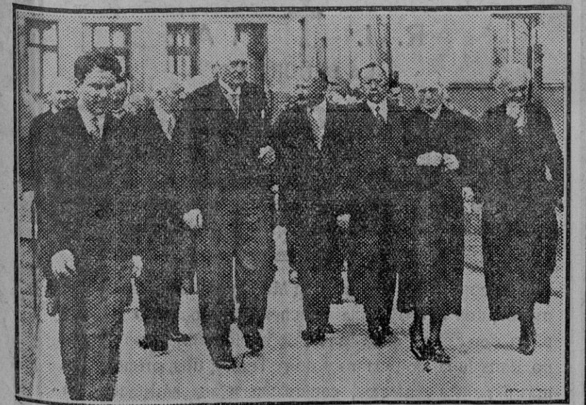
VARSOVIA.—El Presidente de la Republica polaca, M. Moscicki (1), dirigiéndose a inaugurar el primer Instituto de Radium en Varsovia, acompañado de las altas autoridades sanitarias de ese país y la gran científica madame Curie (2), que hizo el viaje desde Paris para asistir a esa gran obra de la ciencia moderna.