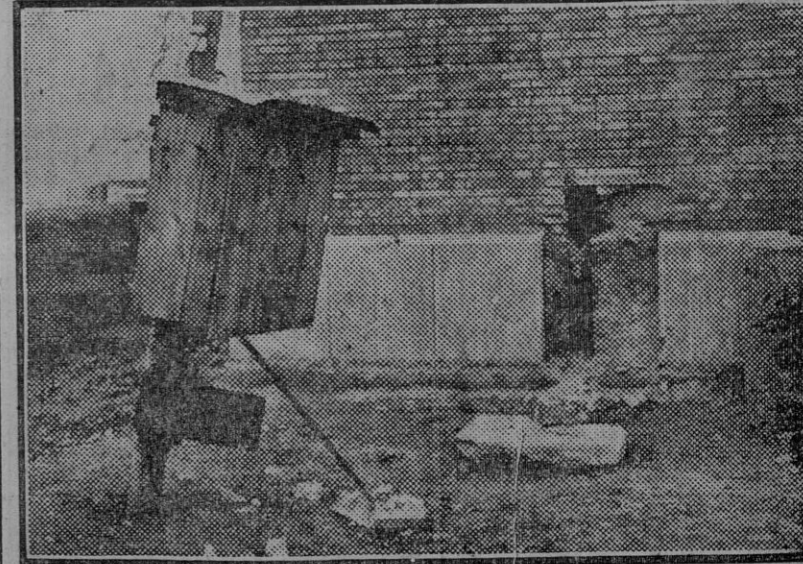
Por la presente foto verán nuestros lectores los efectos causados por la explosión del petardo que anoche estalló en el nuevo templo que se construye en la Avenida de Mayo. El explosivo fué colocado como a un metro de altura y la fuerza de la explosión arrancó un bloque de piedra que estaba adosado al muro, abriendo un boquete como de unos treinta centímetros y derribó el poste que aparece delante, que se encontraba como a dos metros y estaba colocado de un modo provisional en dicho lugar.

Varios propietarios de industriales de Bormujos nos remiten un escrito en el que protestan del repartimiento general de utilidades del año de 1931, que estiman ilegal y lleno de arbitrariedades.