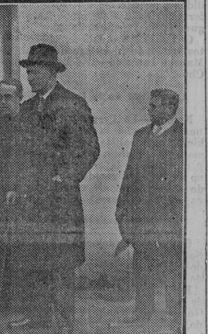
El gobernador civil, con el rector y el prefecto, durante la visita de inspección para el acto de entrega del Colegio