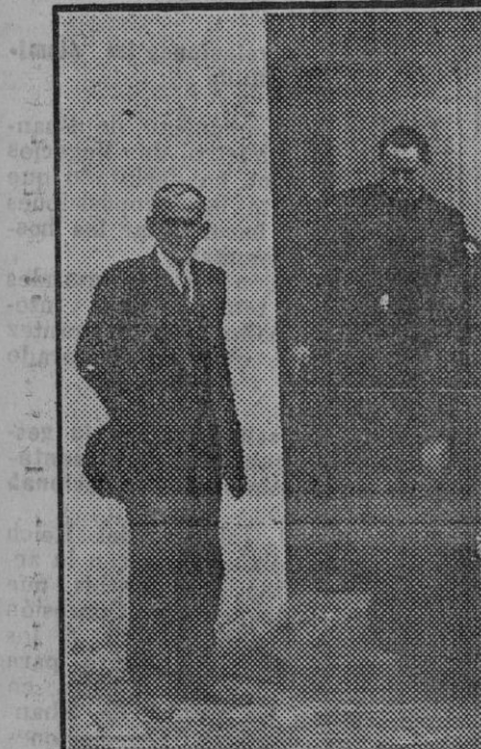
El gobernador civil, con el rector y el prefecto, durante la visita de inspección para el acto de entrega del Colegio

Este Sindicato se ha creado de todo cuanto entregara las secciones que lo componen, como a ímismo las organizaciones que deseen contribuir a esta obra.