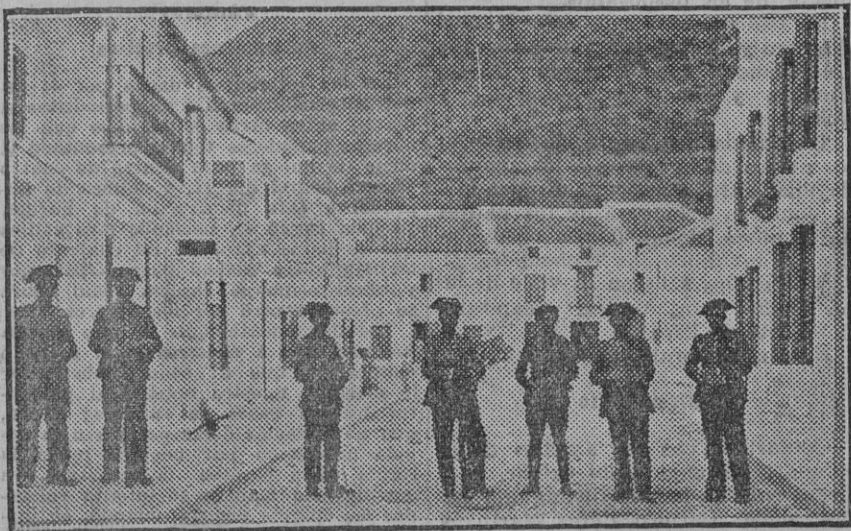
Calle de la Iglesia, donde está el Centro obrero de Izquierda Republicana, en el que se encontraron armas y municiones

En un bolsillo de la blusa se le encontraron 0,80 pesetas y una piedra de gran tamaño.