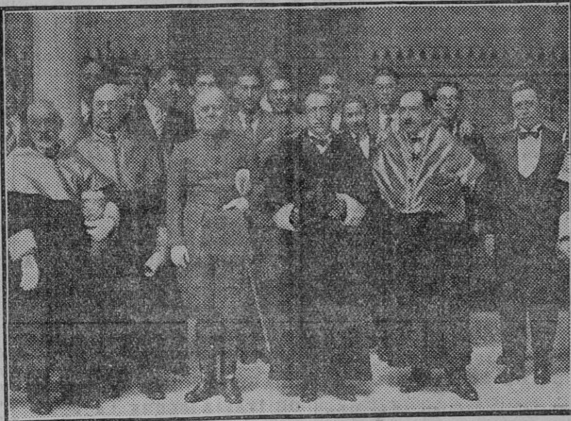
El general Ruiz Trillo y autoridades académicas que asistieron al acto de apertura. (Fdo. Gori.)

Cuando desde nuestra cátedra hablamos a los alumnos de las indicaciones y contraindicaciones operativas en general, y cuando nos hemos ocupado de los procesos quirúrgicos del riñón en las explicaciones dadas en cátedra y en los cursos de la especialidad urológica en diferentes años por nosotros desarrollados, tanto en la Facultad como en el Ateneo de Cádiz, así como en múltiples ocasiones en que hemos tenido que intervenir en comunicaciones de Congresos de Urología sobre temas referentes al diagnóstico y a la intervención quirúrgica de los procesos renales, siempre nos hemos manifestado en el mismo sentido, a saber, defendiendo que, en general, precisa al operador en cirugía y al urologo, desde el aspecto quirúrgico, no olvidar que existe una íntima relación entre todos los órganos y aparatos de la economía, que obligan en estricta conciencia a estudiar los enfermos, aunque éstos sean quirúrgicos, como si fuesen médicos; es decir, que estamos obligados al estudio general del sujeto objeto de nuestra observación desde todos los puntos de vista, y si se trata de renales, con muchísima