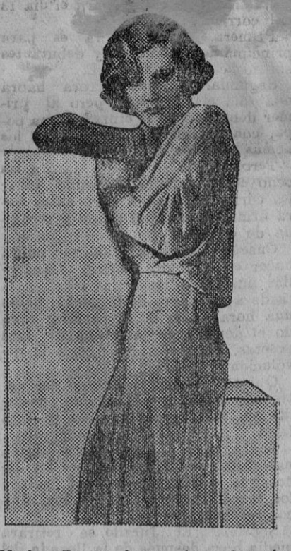
Madge Evans, joven, hermosa, elegante y dispuesta a conquistarse un lugar prominente

Asimismo rogaron al señor Sol que haga pública esta actitud para desvirtuar lo que trata de hacerse creer a los obreros del puerto, que deben comenzar en todo momento la verdadera situación y la actitud de cada cual.