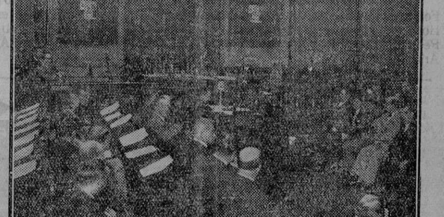
Señal inaugural de la Asamblea de Diputaciones provinciales de España, presidida por el ministro de la Gobernación, señor Maura, celebrada en la Diputación de Madrid

El señor Machado dijo que ahora que la insurrección ha sido sofocada, era preciso que los cubanos se unan para llevar a cabo estos propósitos por vías legales.