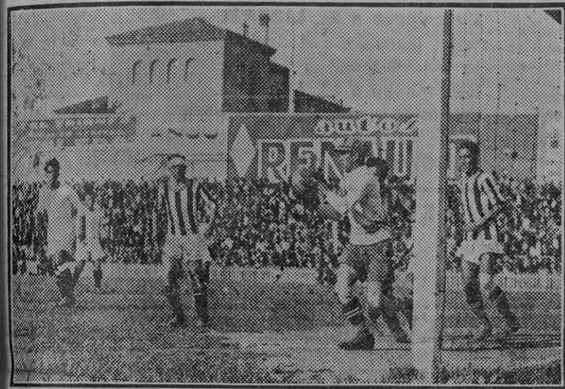
Del partido de ayer en Madrid.—El portero del Castellón blocando un tiro de los sevillanos.