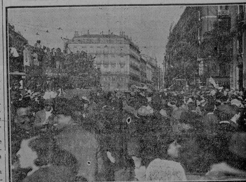
MADRID.—En la Puerta del Sol, el pueblo aclama a la República. (Foto. Díaz Casariego.) (Fdo. Gori.)