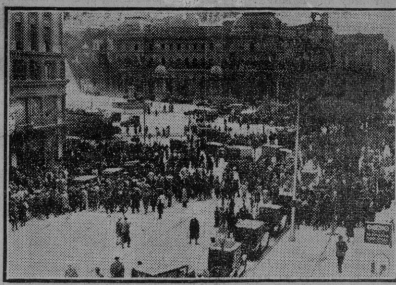
El público contemplando desde la Puerta de Atocha el tiroteo sostenido entre estudiantes y policías (Fdo. Gori.)

Madrid 26.—El «Diario Oficial del Ministerio del Ejército» publica un decreto disponiendo que en virtud de la sentencia dictada por el Consejo de guerra de Jaca, aprobada por el Capitán general de la quinta región, contra el capitán Sediles, comutándole la pena de muerte por la de treinta años de prisión, queden subsistentes las demás partes de que constaba la mencionada sentencia.