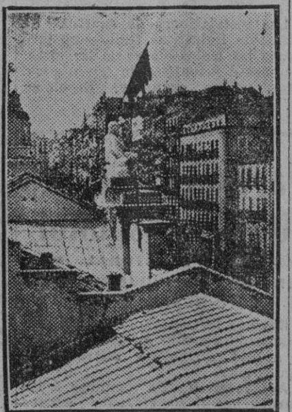
La bandera roja colocada por los estudiantes en la parte más alta de la Facultad, y que no pudo ser retirada por la policía. (Fdo. Gori.)