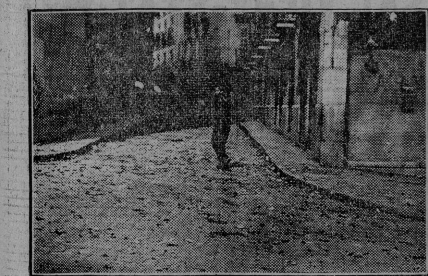
Un aspecto de una calle cercana a la Facultad de Medicina de Madrid, sembrada de ladrillos y piedras, que fueron lanzados por los estudiantes contra la fuerza pública (Fdo. Gori.)

Madrid 26.—En el expreso de Barcelona llegó esta mañana a Madrid el jefe del partido centrista, señor Cambó.