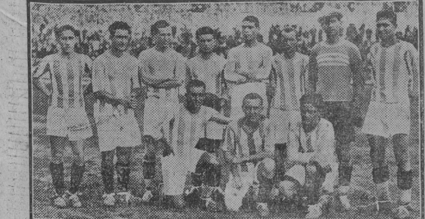
El equipo del Real Club Recreativo de Huelva, que fué batido ampliamente ayer por el campeón andaluz.

LEA USTED MANANA «EL LIBERAL» EL DIARIO MEJOR INFORMADO