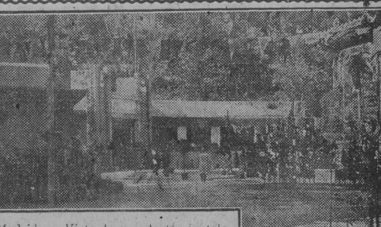
Madrid.—Vista de una de las instalaciones de la Exposición Nacional de Horticultura, instalada en el Retiro.

Hacen el viaje de riguroso incógnito y se alojarán en el hotel Alfonso XIII. Los príncipes de Takamatsú permanecerán aquí el 12 y marcharán al día siguiente para Córdoba y Granada.