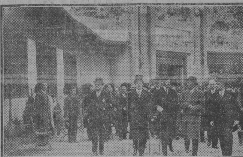
MADRID.—El Rey inaugurando la Exposición Nacional de Horticultura

La última fuga ha sido por demás interesante.