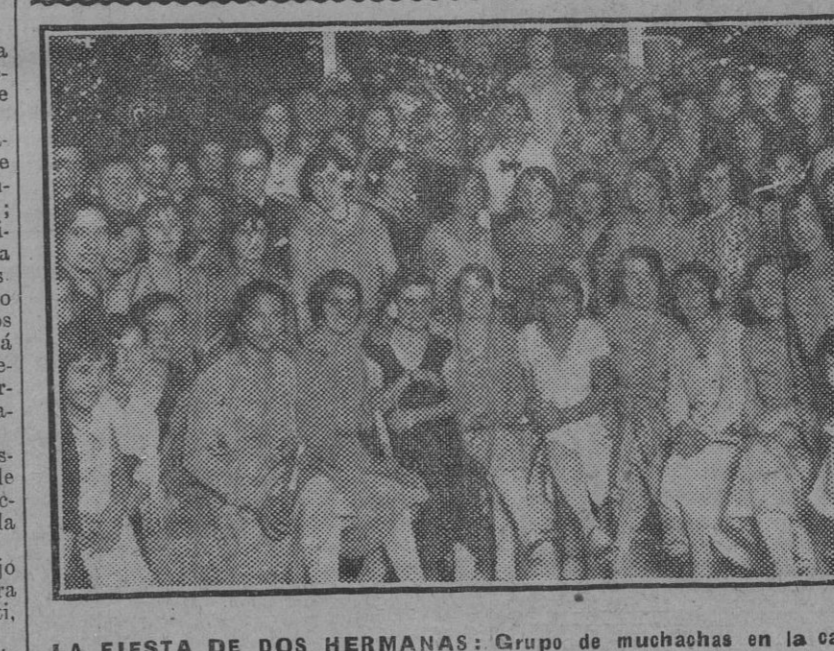
LA FIESTA DE DOS HERMANAS: Grupo de muchachas en la caseta del Casino.