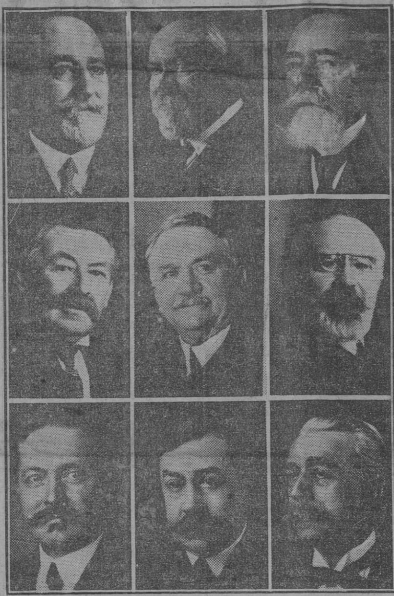
CANDIDATOS A LA PRESIDENCIA DE LA REPUBLICA FRANCESA