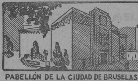
PABELLÓN DE LA CIUDAD DE BRUSELAS

AL COMPRARLO fijarse en el nombre «MAGGI» y las etiquetas en rojo y amarillo