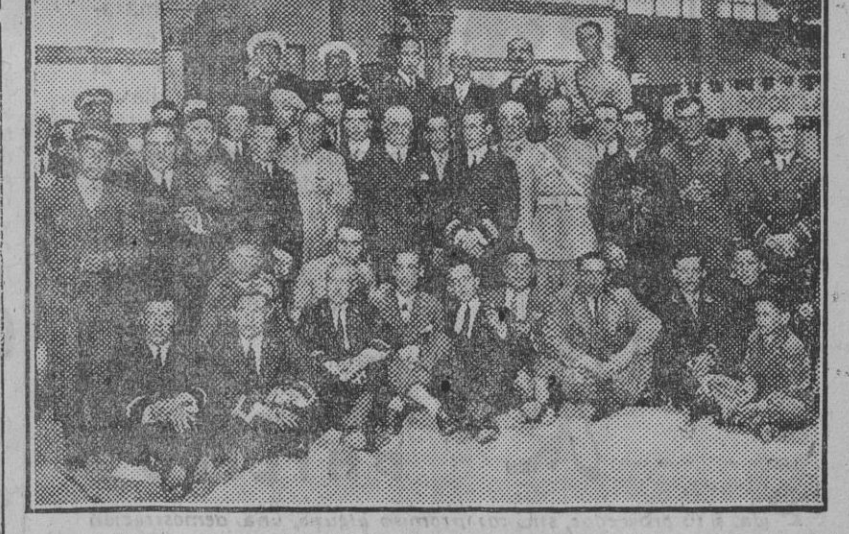
Los subalternos de los pabellones regionales y provinciales, después del banquete de despedida.

El próximo domingo, 15 del actual, a las cuatro de la tarde, se celebrará sesión general en el domicilio social, calle O'Donnell, 13. Lo que se anuncia para conocimiento de las asociadas, rogando puntual asistencia.