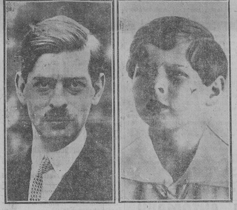
El príncipe Carlos (a la izquierda), elevado al Trono de Rumania, y el príncipe Miguel, heredero del Trono.