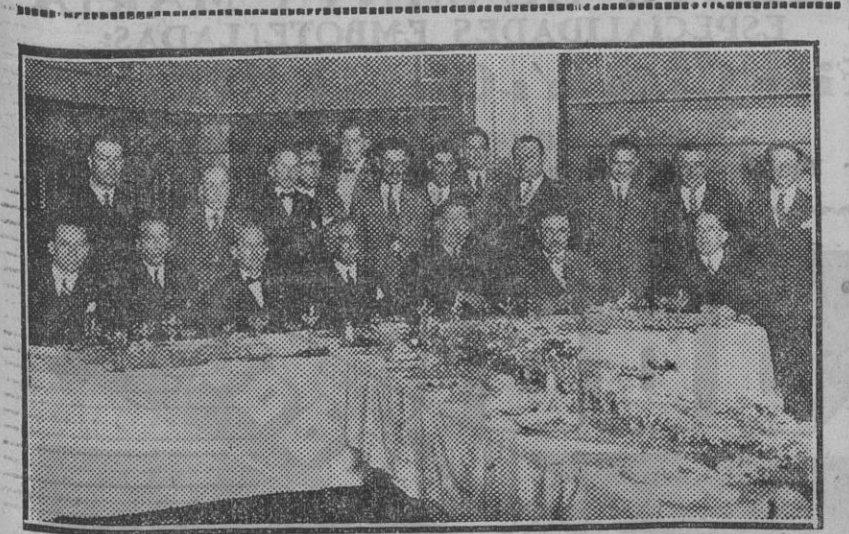
El comisario regio de la Exposición y los delegados ibero-americanos, durante el almuerzo con que fueron obsequiados en el pabellón de Méjico