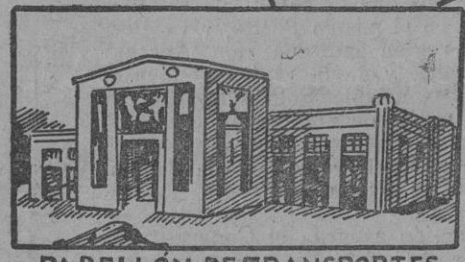
PABELLÓN DE TRANSPORTES

CENTENARIO DE LA INDEPENDENCIA BELGA EXPOSICION INTERNACIONAL DE DEPORTES, MÚSICA, DIVERSIONES INDUSTRIA, CIENCIAS, PURAS Y APLICADAS, AGRICULTURA MAYO-NOVIEMBRE 1930