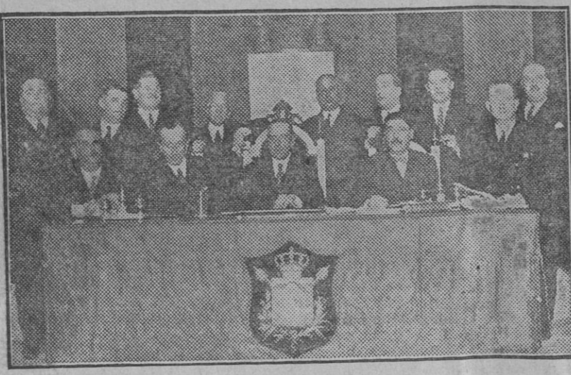
Toma de posesión de los tenientes de alcalde