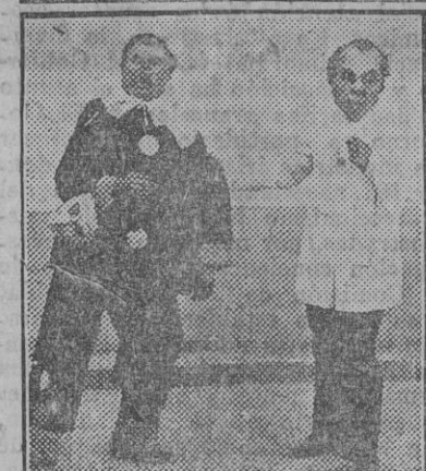
1 y 2.—Grupos de lindas mascaritas que figuraban en el Carnaval Romántico, de la cabalgata de hoy. 3.—El camarero y el Pirot que no paga la cuenta.