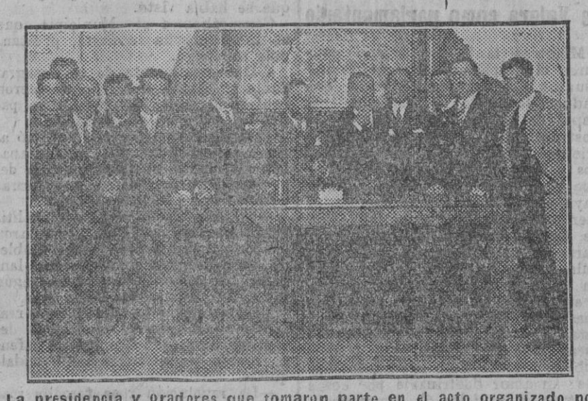
La presidencia y oradores que tomaron parte en el acto organizado por la Cámara de Inquilinos.