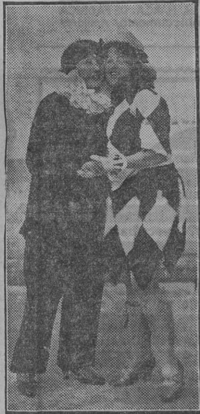
Una pareja del Carnaval romántico

Gramófonos, discos y máquinas fotográficas. Casa sin balcones.