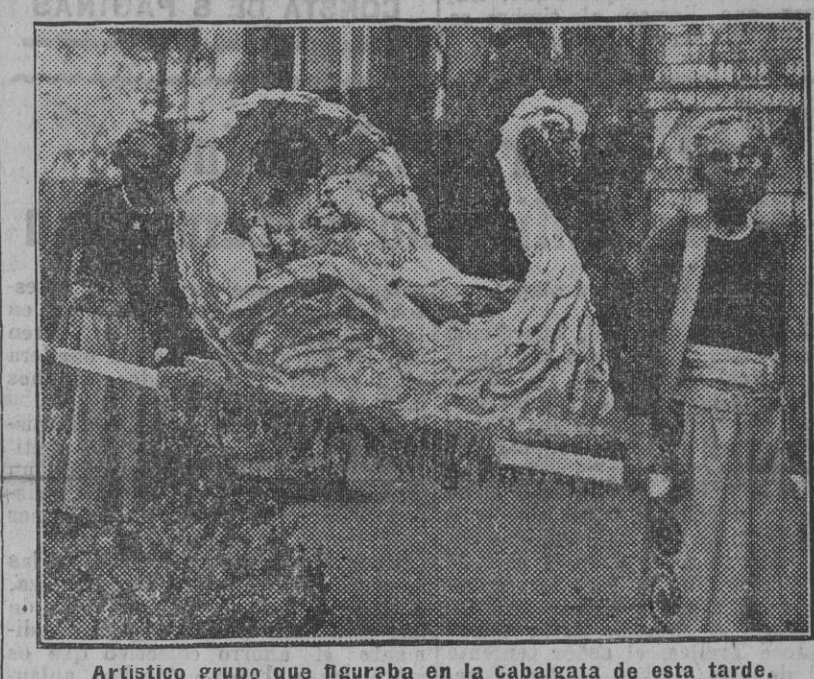
Artístico grupo que figuraba en la cabalgata de esta tarde.