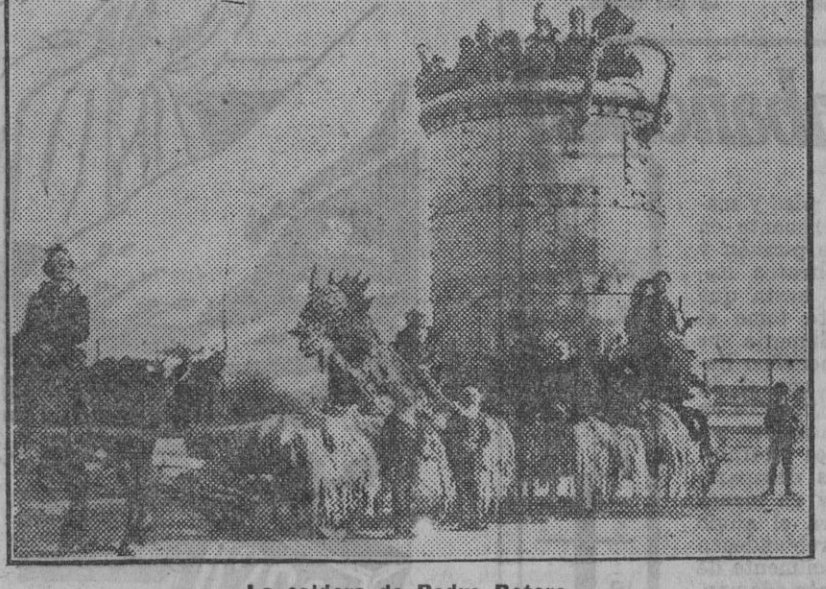
La caldera de Pedro Botero