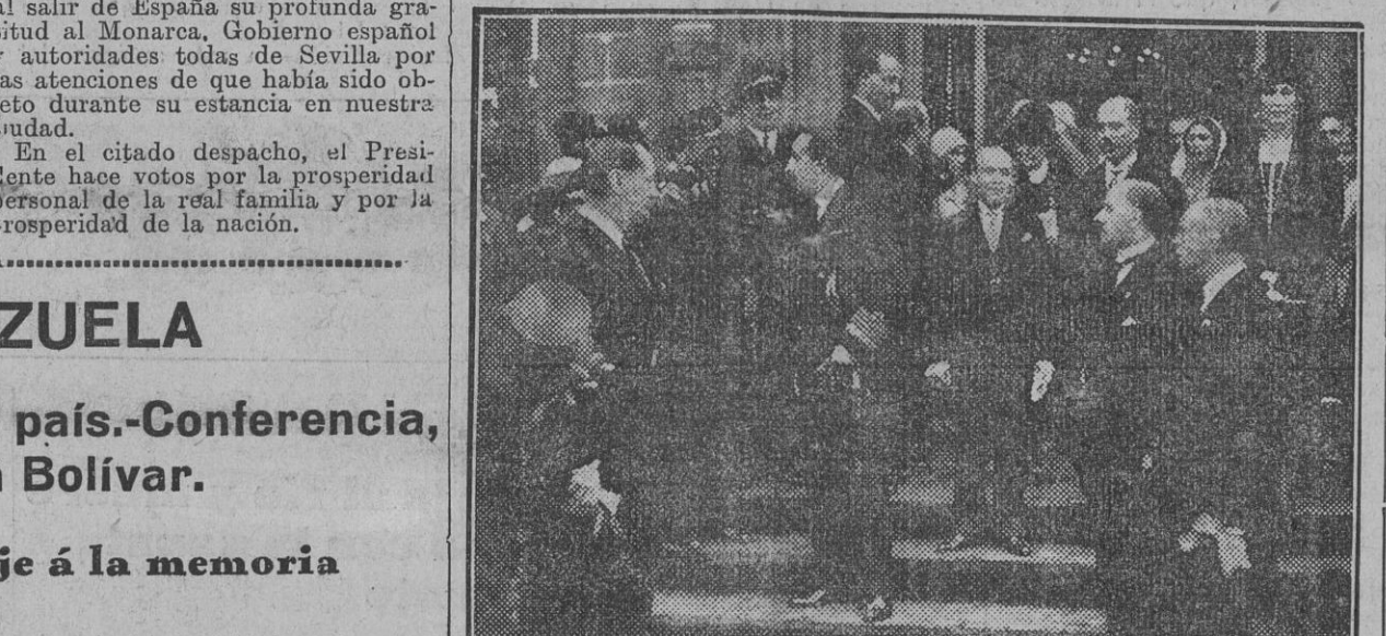
Los Reyes saliendo de inaugurar el Pabellón de Castilla la Vieja y León.