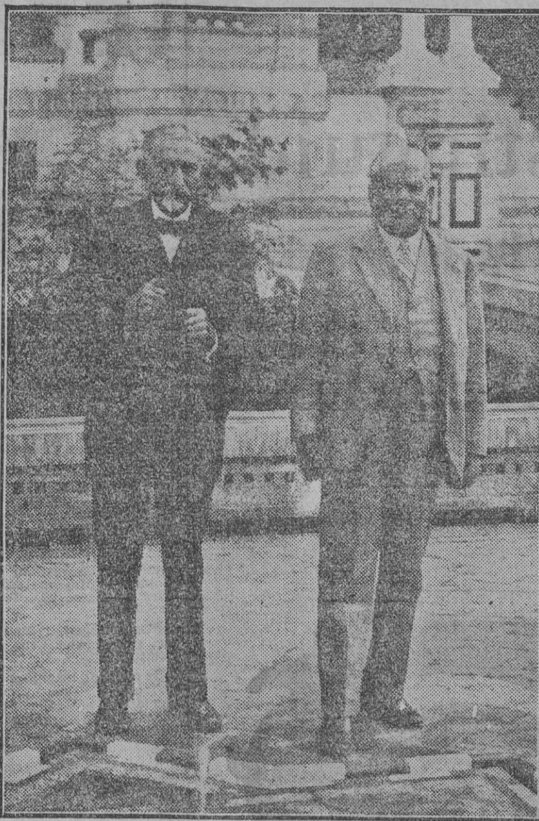
El maharajah Burdwin de Baroda, que se encuentra en Sevilla visitando la Exposición y los principales monumentos. (Foto obtenida en el patio del Gran Hotel Alfonso XIII, donde se hospeda el soberano indio).

El Comité de la Exposición prepara festejos populares en ella, y si fuere posible, SS. MM. también asistirán a la colocación de la primera piedra de la futura barriada de casas ultrabarratas en Amate y la Corza.