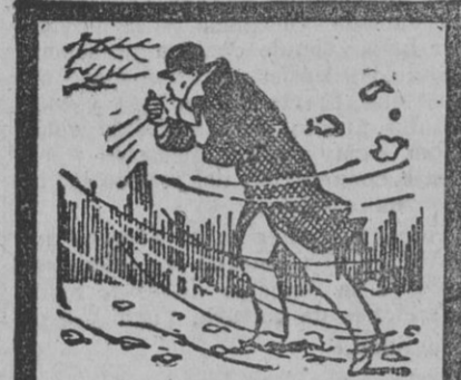
Todos los años, con los primeros fríos, reaparece la tos de Vd. porque tiene sus pulmones débiles...