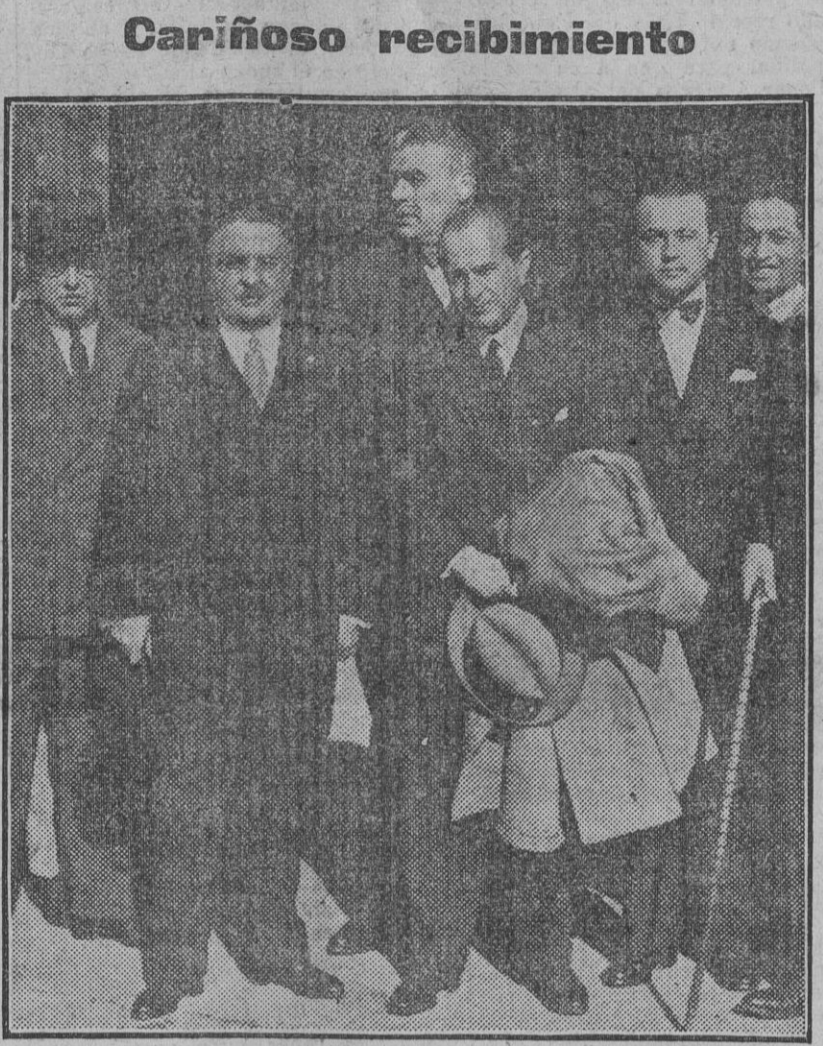
Esta mañana ha llegado, procedente de Madrid, el embajador extraordinario acreditado por el Gobierno de Chile...