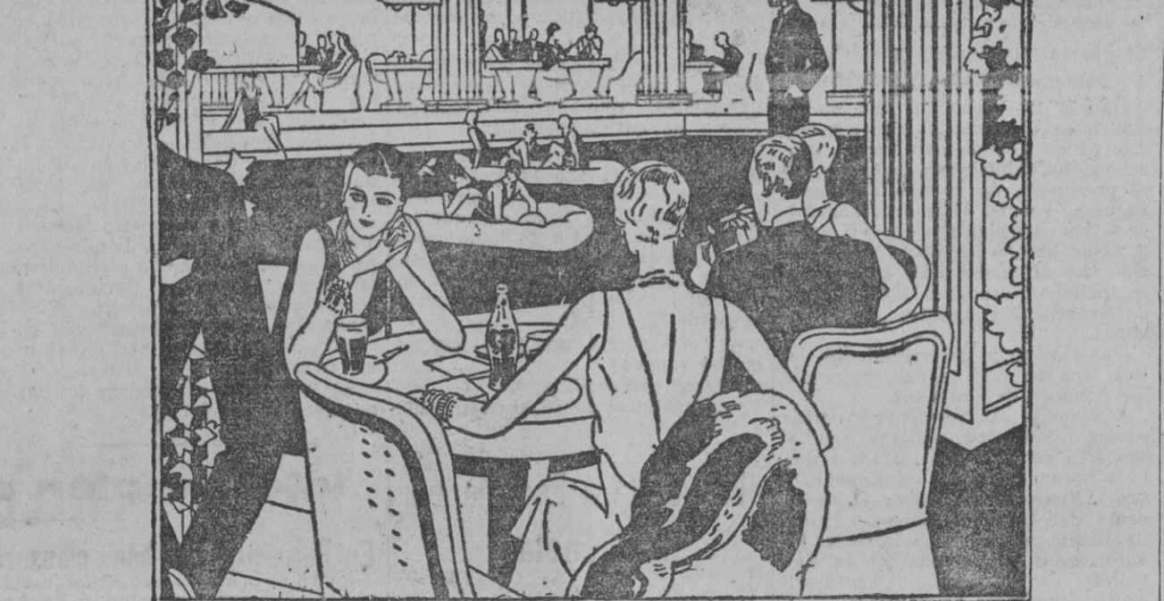
Saborear un vaso de Coca-Cola es un deleite del que no saben prescindir los paladares refinados

Materiales de construcción y fábrica de tubería de cemento.