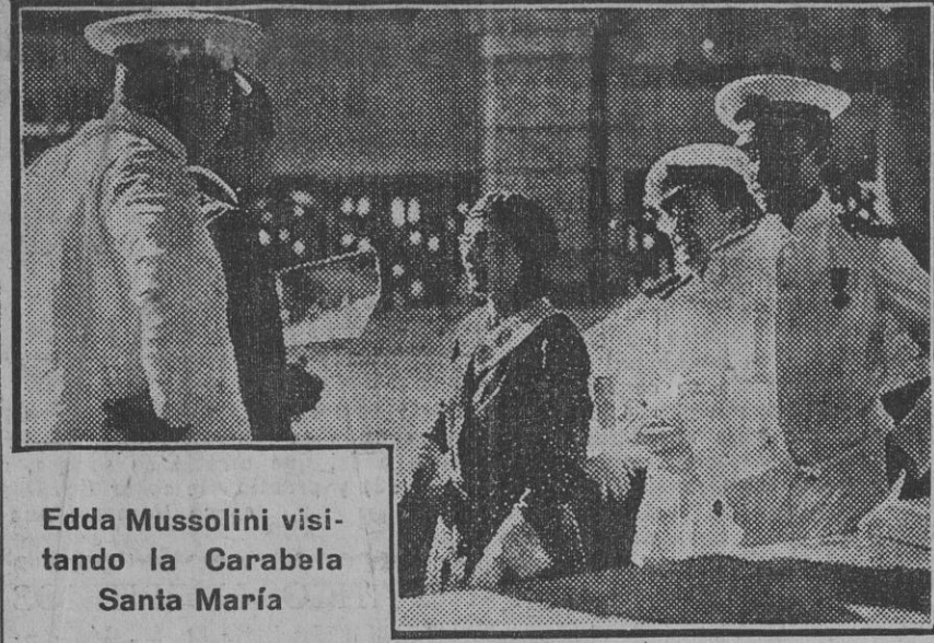
Edda Mussolini visitando la Carabela Santa María

construido en la alineación aproba da un solar de la Huerta del Barrero con fachada a la calle Beato Rivera y callejón del Meadero.