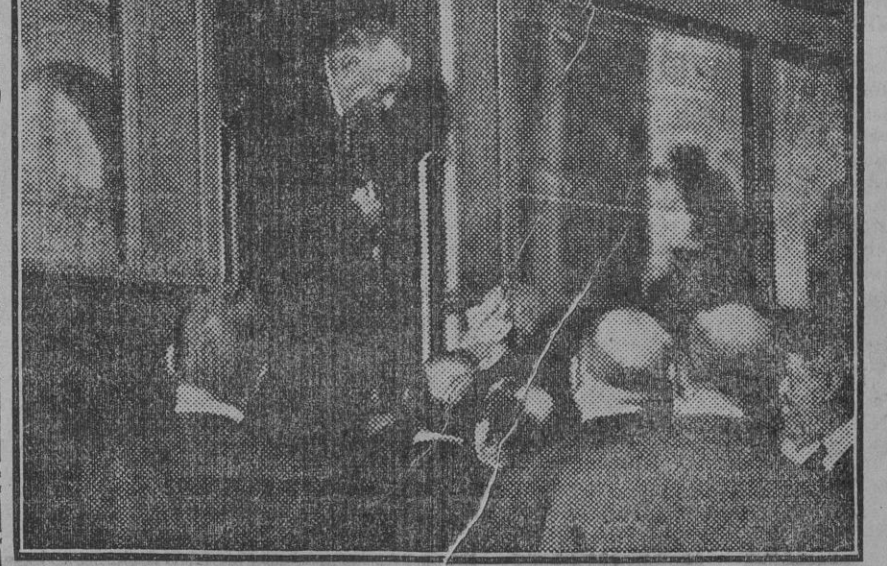
Paso por Sevilla del general Primo de Rivera. El Presidente hablando con las autoridades que le esperaban.

A las nueve y media en punto de esta mañana llegó a la estación de San Bernardo el tren procedente de Madrid, en el que se dirigía a Jerez el Presidente del Consejo de ministros, general Primo de Rivera.