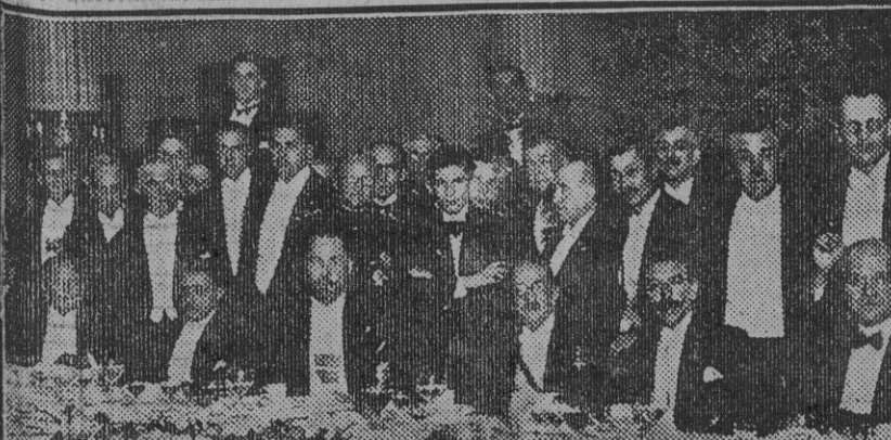
Banquete ofrecido por el ministro de Colombia y la Delegación colombiana en la Exposición Ibero-Americana.