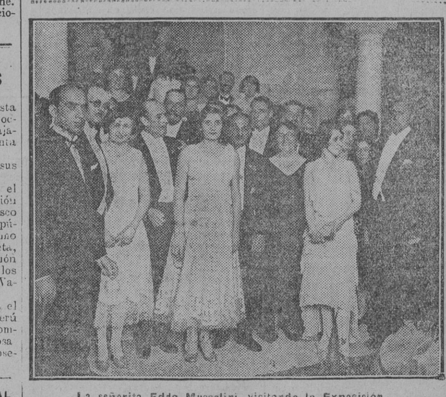
La señorita Edda Mussolini visitando la Exposición.