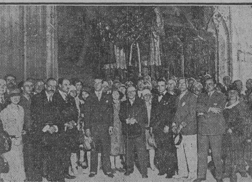
Los profesores y estudiantes italianos que se encuentran en Sevilla y que esta mañana han depositado una corona en el monumento que guarda las cenizas de Cristóbal Colón.

Bien merece ese bello ejemplar de pórtico que pueda ser contemplado en dicha fecha por los sevillanos y los numerosos forasteros que nos visitan.