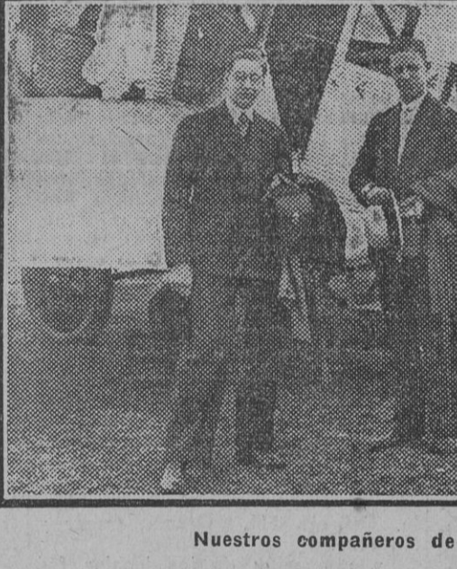
Nuestros compañeros de viaje.

tienen hoy esta ruta ideal, que en línea recta, trazada sobre la aldimera de un admirable azul cobalto, une a ambas ciudades andaluzas merced al celo de la Unión Aérea Española, que va a dotar a Sevilla de una tan extensa y tupida red aérea, que será la cabecera española de las comunicaciones y transportes por aire.