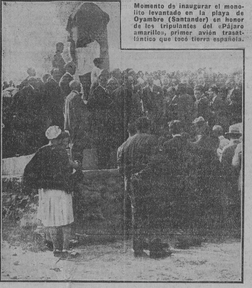
Momento de inaugurar el monolito levantado en la playa de Oyambre (Santander) en honor de los tripulantes del «Pájaro amarillo», primer avión trasatlántico que tocó tierra española.

que, en efecto, quedó demostrado en el expediente que motivó la separación definitiva del aludido funcionario, sobre cuya verdadera personalidad aún existen dudas, por no haber logrado presentar a distintos requerimientos que se le hicieron los documentos acreditativos de la misma. Añadió el alcalde que no debe decir nada que suponga prejuzgar la resolución que las dignas autoridades judiciales den al asunto. Si le interesa hacer constar que él, como los tenientes de alcalde y concejales, tiene el más alto concepto de los funcionarios que actualmente prestan sus servicios en la Sección de Arbitrios en todos sus ramos. Para estos últimos, que han logrado elevar la recaudación de un modo considerable, y que han ayudado eficazmente a la dignificación del personal subalterno de administración y vigilancia, quiere tener con este motivo, y porque se da cuenta del sentimiento que en ellos ha producido el conocimiento de la noticia que comenta, los mayores elogios.