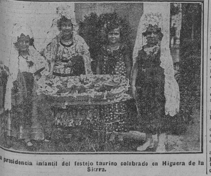
La presidencia infantil del festejo taurino celebrado en Higueras de la Sicra.

en estado relativamente satisfactorio y custodiado convenientemente para que no repita sus autocarras, verdadera obra de un loco.