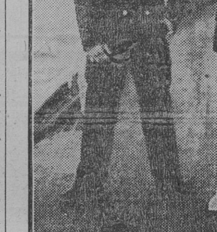
Los tres protagonistas del sangriento epílogo del "raid" marítimo Puerto Rico-Sevilla. (hecha a la llegada del "Mary" a Sanlúcar de Barrameda.)