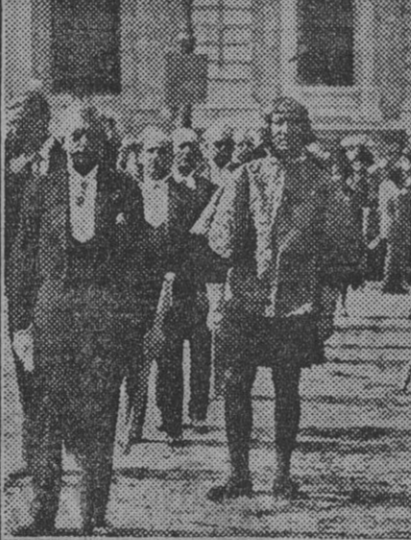
El histórico pendón de la ciudad.

Según lo dispuesto por la autoridad militar, las tropas cubrieron la carrera de la siguiente forma: Soria.—Las tres compañías, desde la Puerta de San Miguel, de la Catedral, en calles Gran Capitán y Canovas del Castillo.