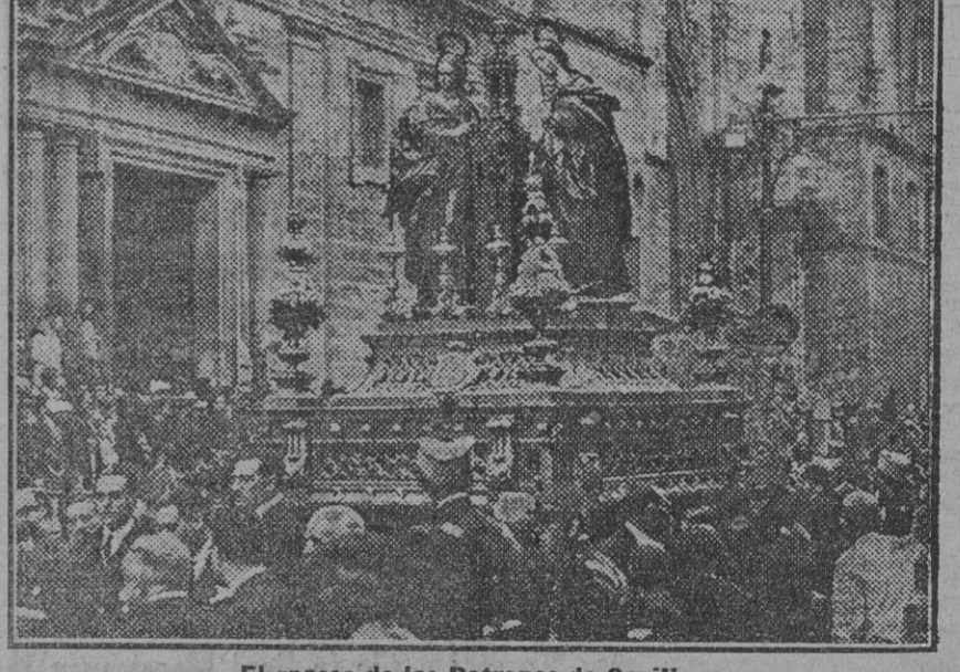
El «pasos» de las Patronas de Sevilla.

Las últimas impresiones de la tarde relativas a la enfermedad que sufre el ilustre arquitecto don Anibal González no pueden ser más desconsoladoras. Parece que la dolencia ha llegado a un estado de gravedad extrema.