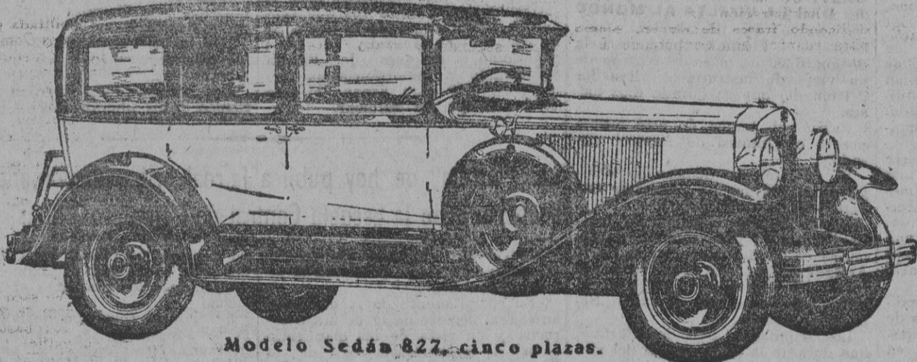
Modelo Sedán 827, cinco plazas.

Estos nuevos modelos Graham-Paige para 1929, ofrecen una gran variedad de carrocerías, incluyendo Roadsters, Cabriolets, Coupés y Sport Phantoms, sobre cinco chassis distintos, de seis y ocho cilindros, a precios al alcance de todos. Van provistos de transmisión de cuatro velocidades, exceptuando el modelo 612.