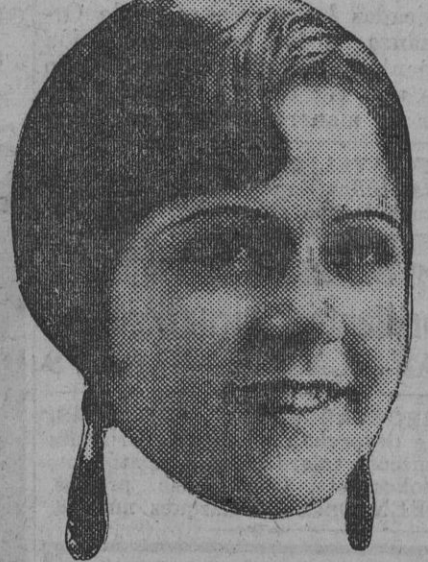
Núm. 28.—Sevilla. Lema: MACARENA.