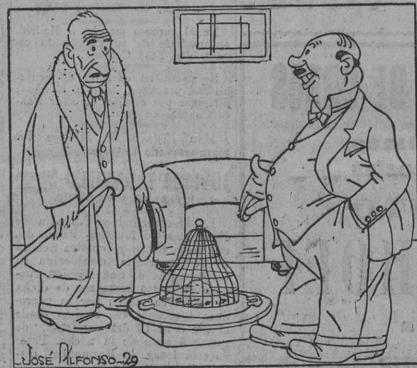
—Yo no le temo al frío porque tengo calefacción central. —Pero si eso es un brasero! —Bueno; pero está en el centro de la habitación.