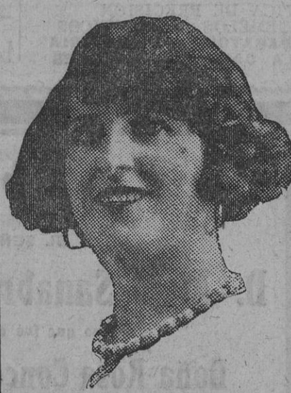
Núm. 27.—Sevilla. Lema: ESPERANZA.