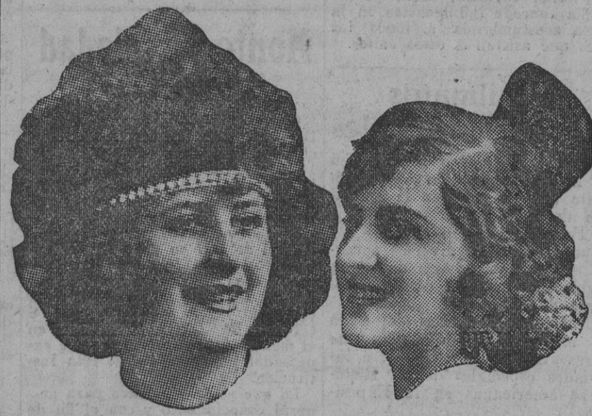
Núm. 25.—Granada. Lema: ROSAS DE LOS CALÉS.