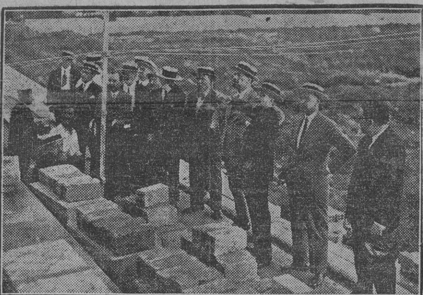
El comisario regio de la Exposición, el alcalde y miembros de la Permanente, en la visita que ayer hicieron al «Stádium», cuyas pruebas definitivas se celebrarán esta tarde. (Fdo. Govi.)

«No le asusta el calor de Sevilla?—preguntamos a Lipo, que daba muestras de sentir «a todo régimen» los efectos de la noche encalmada y caliginosa, y sonrió diciendo: «De nuestra pregunta, nos contestó: «En Hungría hace tanto calor como en Sevilla, y a mí esto, no me coge de sorpresa. Casi estoy por decirle que hace en mi país más calor que en Andalucía...»