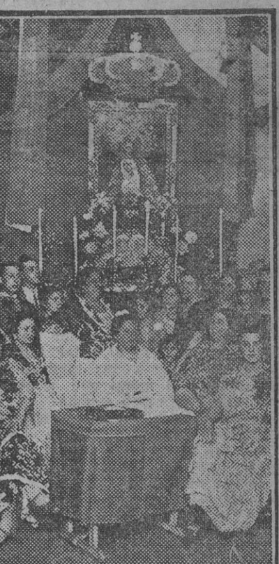
El altar que las vendedoras de la cuartelada de la reconv instalaron á la entrada de la misma. (Foto. S. del P.) (Fdo. Gori.)