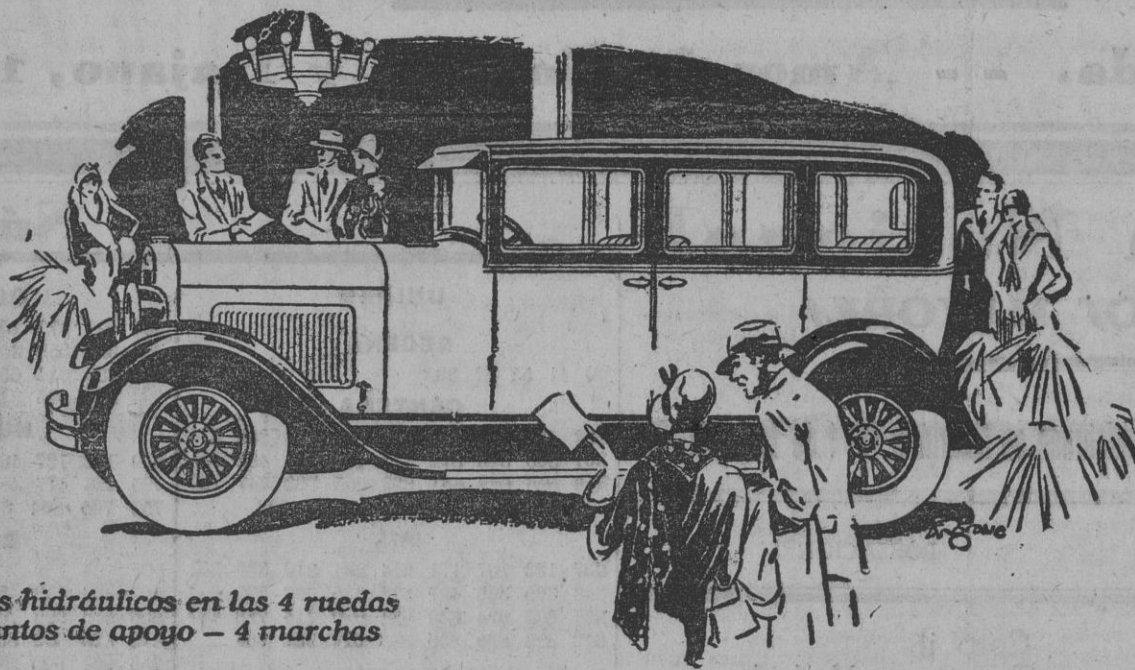
Frenos hidráulicos en las 4 ruedas 7 puntos de apoyo - 4 marchas