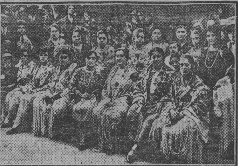
Las representaciones de los mercados de los barrios de Triana y Feria en la fiesta de ayer.

El carácter netamente agresivo de este ejército, está demostrado, no sólo por los discursos citados anteriormente, y otros del mismo estilo, por el hecho de que no se trata de la defensa de un pequeño país amenazado por otros más poderosos, sino de un Estado que cuenta con 130 millones de habitantes, que es mucho más fuerte que todos sus vecinos, y al que nadie piensa atacar.