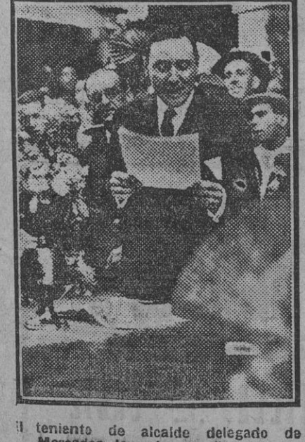
El teniente de alcalde delegado de Mercados leyendo su discurso.