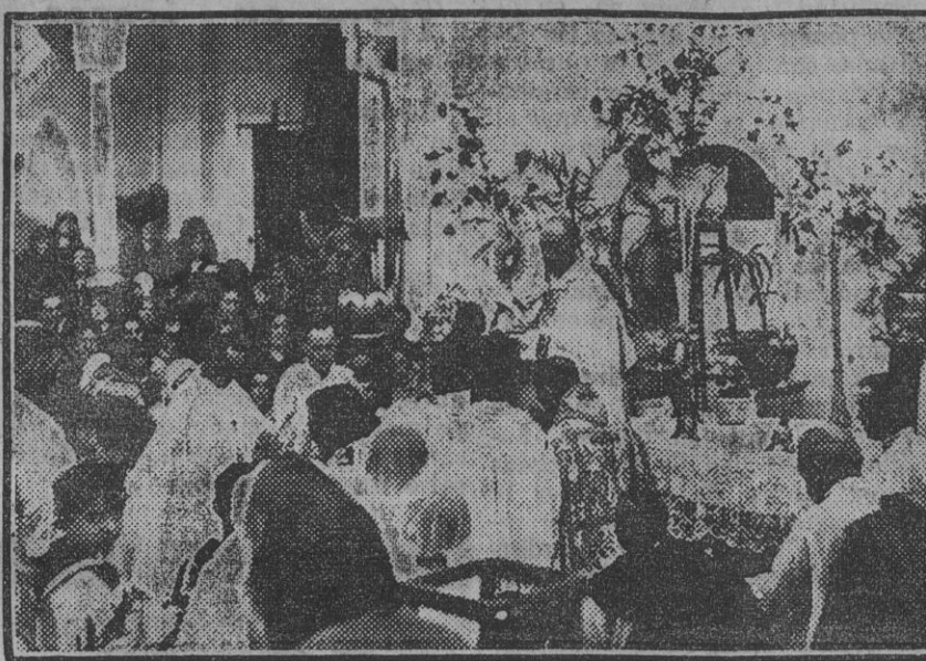
La solemnidad religiosa del jueves último en el Colegio de las RR. Carmelitas