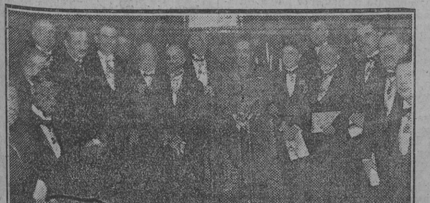
Personalidades concurrentes á la recepción.

Además de la piedra filosofal, no hallada aún, se habla de otras cuatro piedras, con cuya posesión se obtienen, respectivamente, la inviolabilidad, la agilidad, la impasibilidad y la inmortalidad, que tampoco han sido halladas. En cambio, existe una piedra preciosa que está al alcance de todas las trujeras, una especie de rubí encendido, como aparecen los labios con el índice rojo-mate «Jugo de Rosas». Lágrimas á 0,75, 1 peseta, 1,20 y 1,40. Líquido, envase corriente, 3 pesetas. Fabricado por Floralia, creadora del supremo Jabón «Flores del Campo».