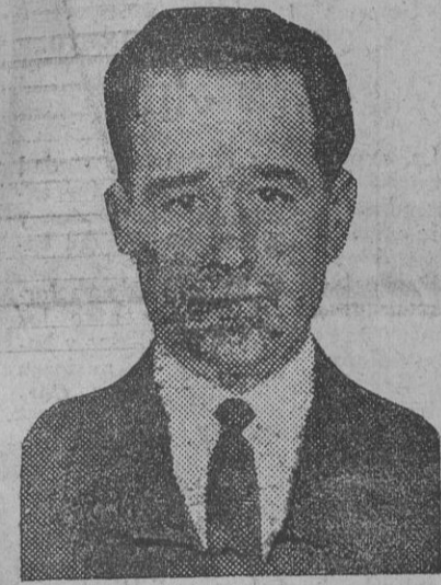
El notable poeta Rodríguez Mateos, que el pasado sábado dió en el Ateneo una lectura de sus poesías.