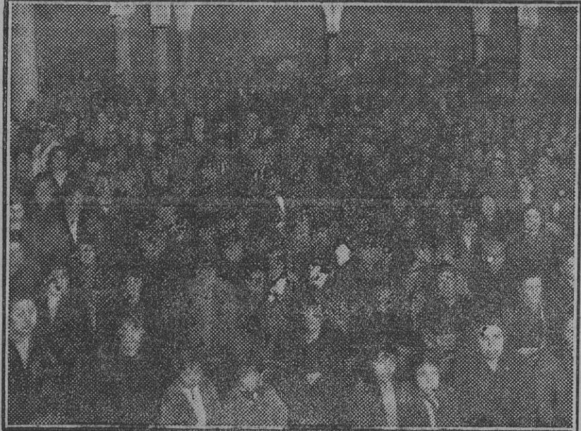
Aspecto de la sala durante e la celebración del acto.