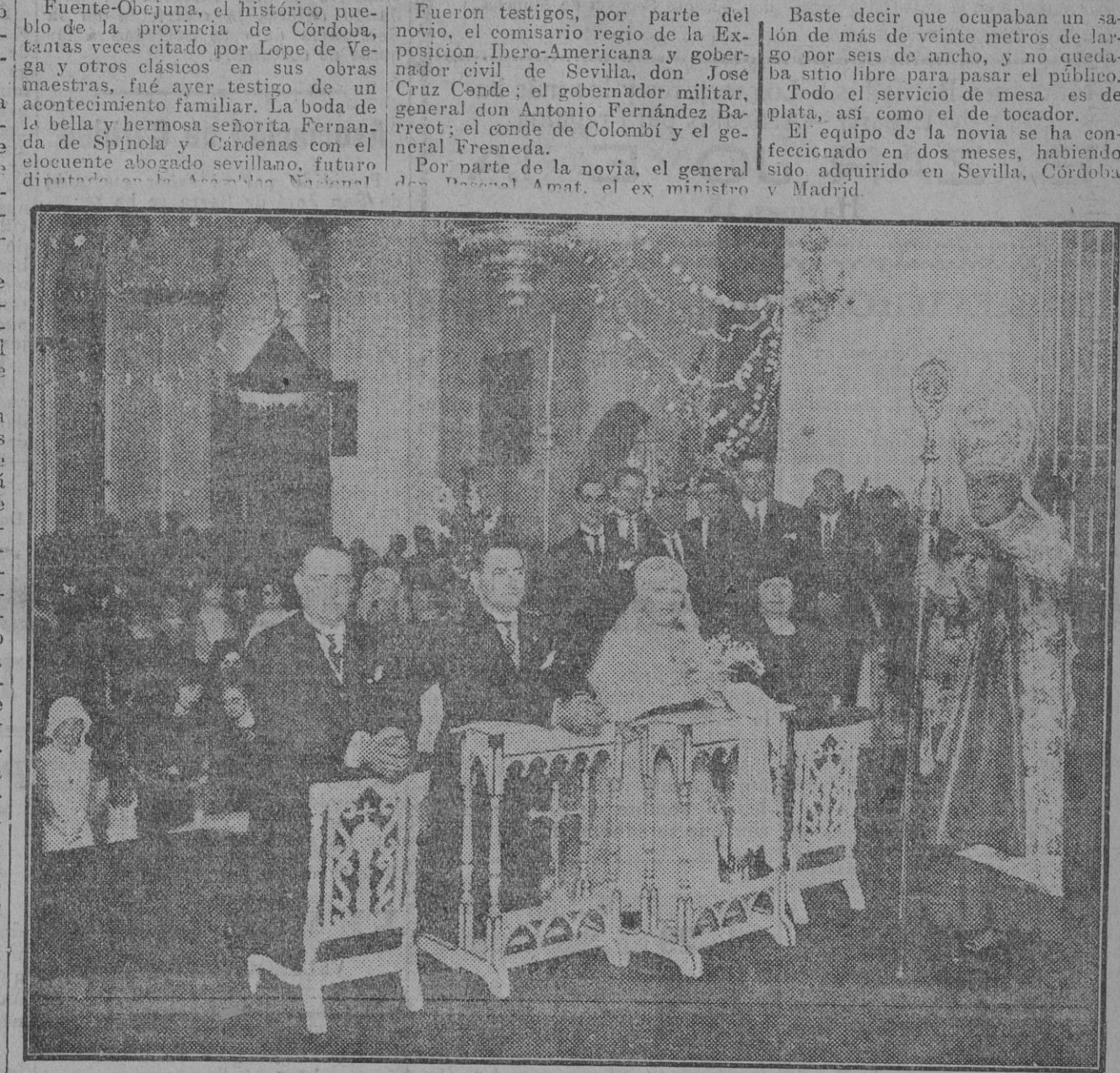
El obispo de Córdoba después de bendecir a los novios, que aparecen en la fotografía con sus tíos y padrinos los señores de Castillejo.