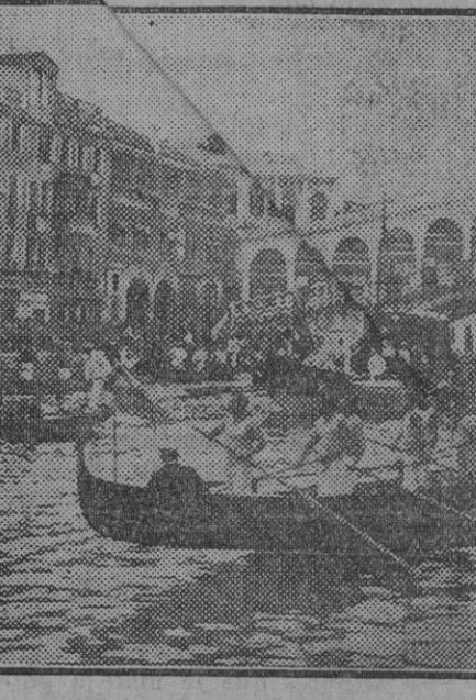
El duque de Bergamo en la góndola oficial, presenciando desde el puente de Rialto la comitiva de las embarcaciones que tomaron parte en las regatas celebradas en el gran canal.

Por su parte nuestro redactor terminaba la información, asegurando que en Méjico trabajaría Bombita durante el invierno de 1904, retirándose del toreo en definitiva cuando regresara a España.