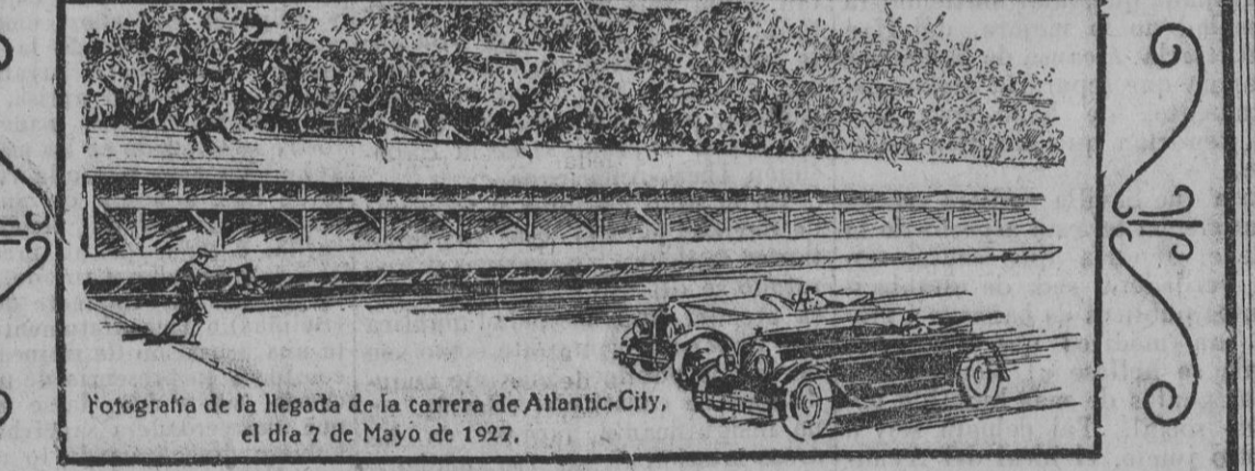
Fotografía de la llegada de la carrera de Atlantic-City. el día 7 de Mayo de 1927.

Primero: "STUTZ" Segundo: "AUBURN" a 1 m. Cuarto: "AUBURN"