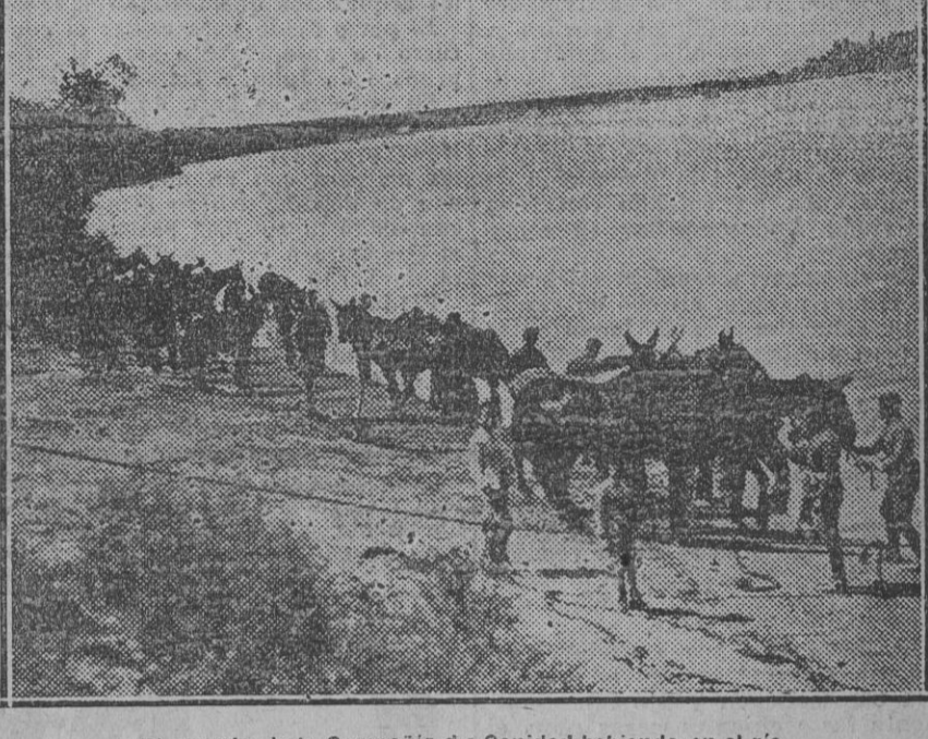
El ganado de la Compañía de Sanidad bebiendo en el río.