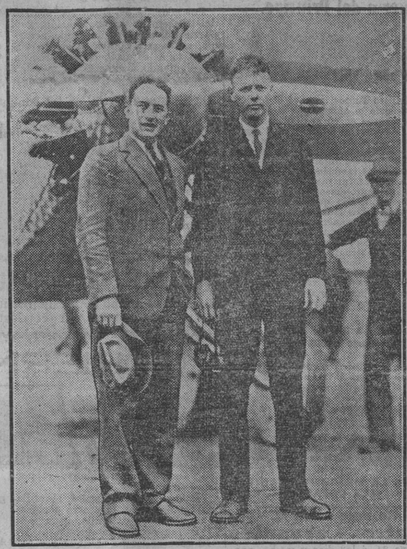
El Capitán Charles Lindbergh (El loco del aire), sólo, sin aparatos de radio ni flotadores, partió tripulando el aparato «San Luis», para obtener el premio de 25.000 dólares.