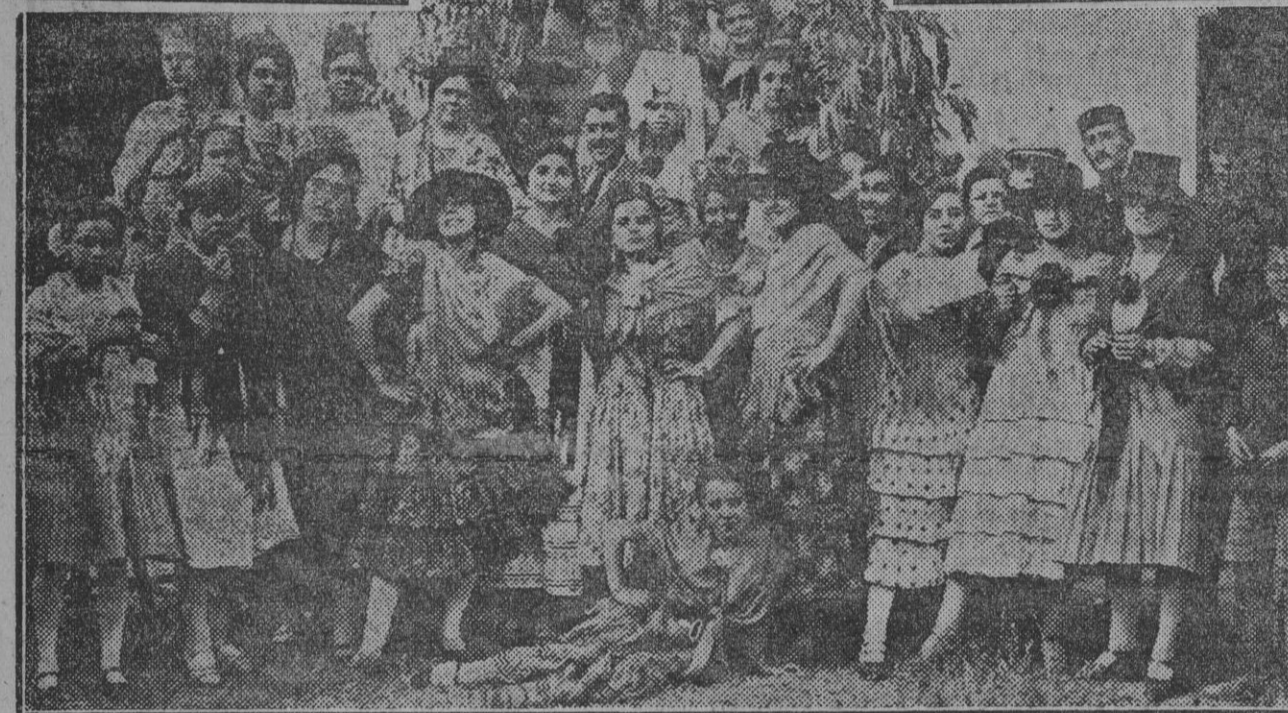
Abajo, bellas jóvenes que ocupaban una de las carretas y contribuyeron con sus típicos bailes al mayor realce de la brillante fiesta.

La Junta de damas de la Cruz Roja puede sentirse orgullosa de la fiesta que organizara ayer en honor de los Reyes y a beneficio de la benemérita institución.