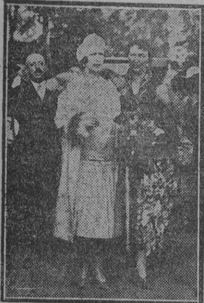
A la izquierda, llegada de la Reina Doña Victoria y de la infanta doña Luisa al lugar de la fiesta.

La fiesta celebrada en Tablada, organizada por la Cruz Roja, resultó brillantísima