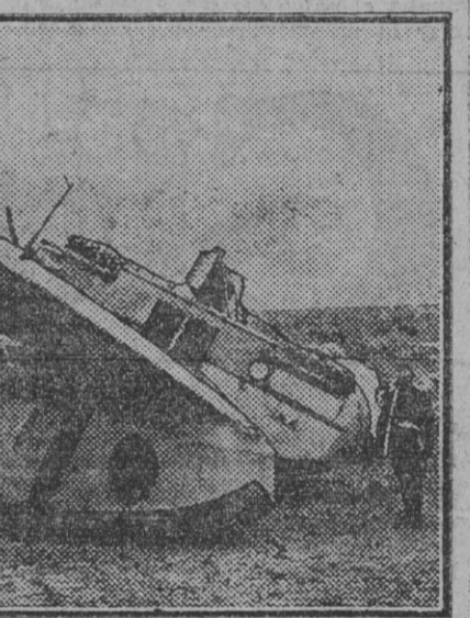
Estado en que quedó el hidro.