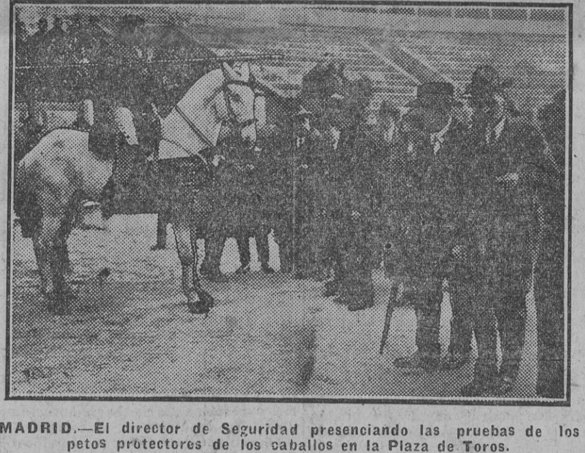
MADRID.—El director de Seguridad presenciando las pruebas de los petos protectores de los caballos en la Plaza de Toros.