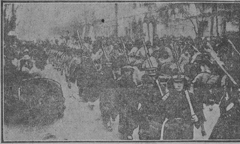
PEKIN.—Tropas conduciendo prisioneros rebeldes al templo de Agricultura para ser juzgados sumarisimamente.