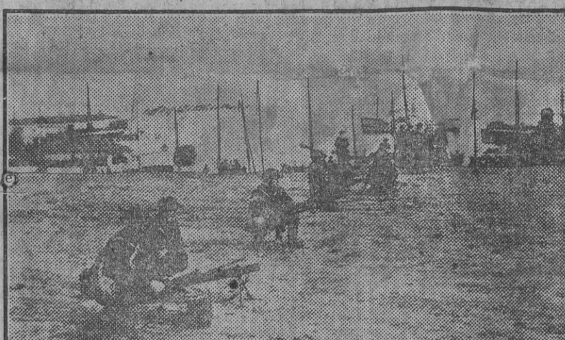
CHINA.—Tiradores de las fuerzas inglesas llegadas á Hankou para mantener el orden y contener á los invasores rebeldes.

Pronto nos lo dirá el que se ha hecho cargo de la dirección técnica del negocio taurino sevillano.