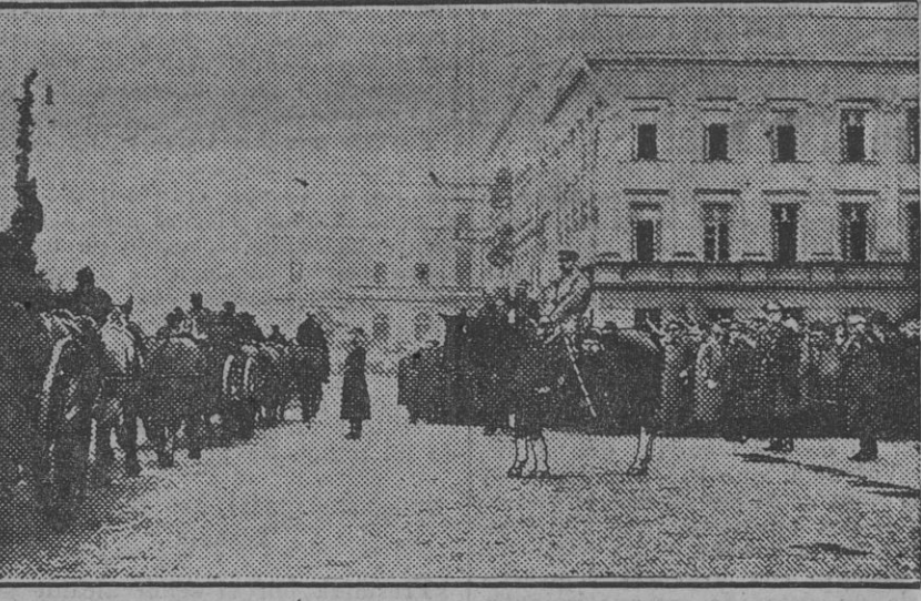
La evacuación de Varsovia por las tropas alemanas tuvo lugar el 11 de Noviembre de 1918. El general Pilsudski, dictador de Polonia, revisando las tropas el día de la conmemoración.