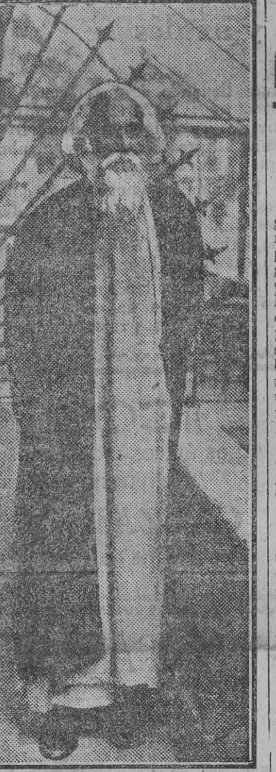
La venerable figura del glorioso poeta indio Rabindranath Tagore. (Fotografía obtenida a su llegada a Londres.)

El vuelo, de poderlo realizar, durará unas treinta y una horas.