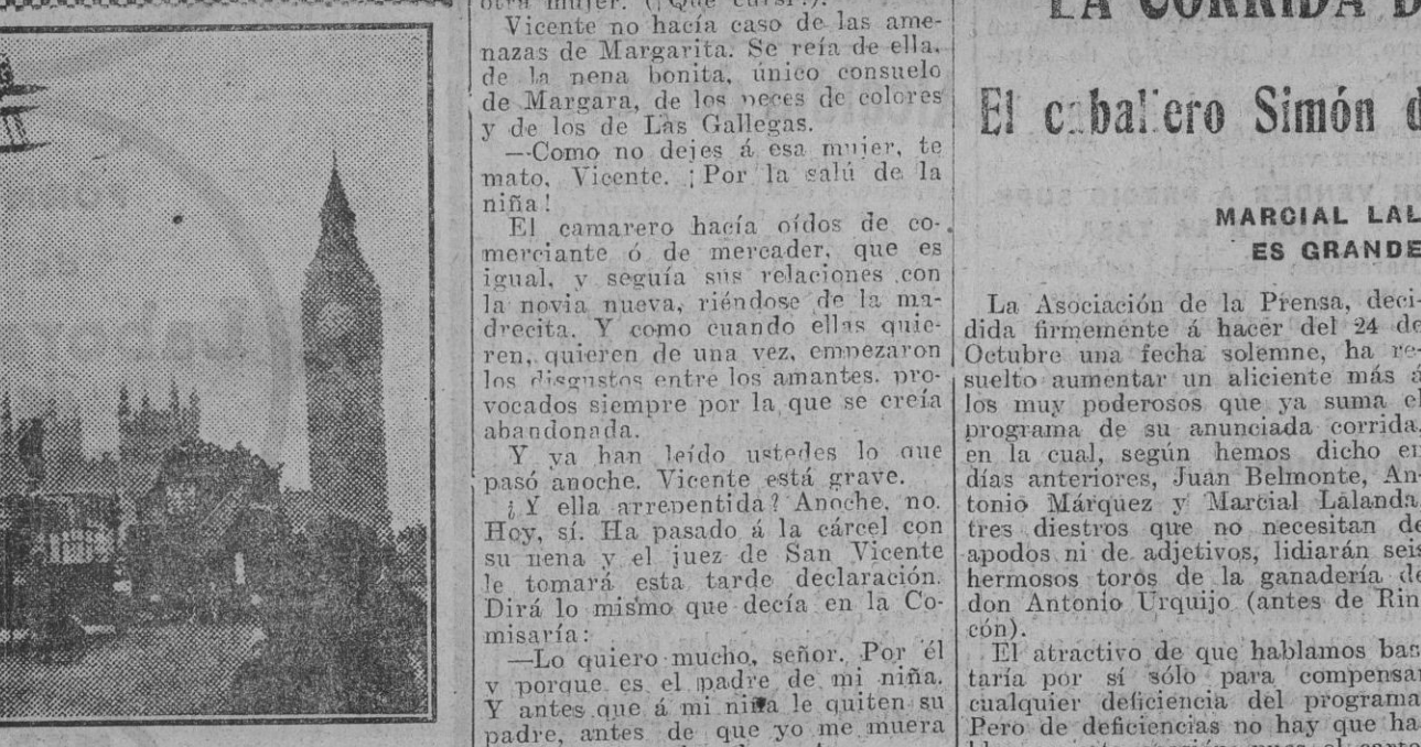
Momento de llegar a Londres el aparato de Alan Cobhan, volando sobre el Palacio Real de Westminster.

ras egoístas, en pugna con la utilidad pública, constituye un obstáculo para las reformas urbanas. Y lo mismo con los inquilinos que, exagerando el interés particular, rebasan la línea de lo justo, oponiendo dificultades inventadas a la prosecución de las mejoras, algunas de las cuales, como en la Campana, Mateos Gago, Villegas y en otros sitios del centro, han quedado empantanadas, dejando sin terminar reformas para las que el Municipio tuvo que realizar grandes sacrificios.