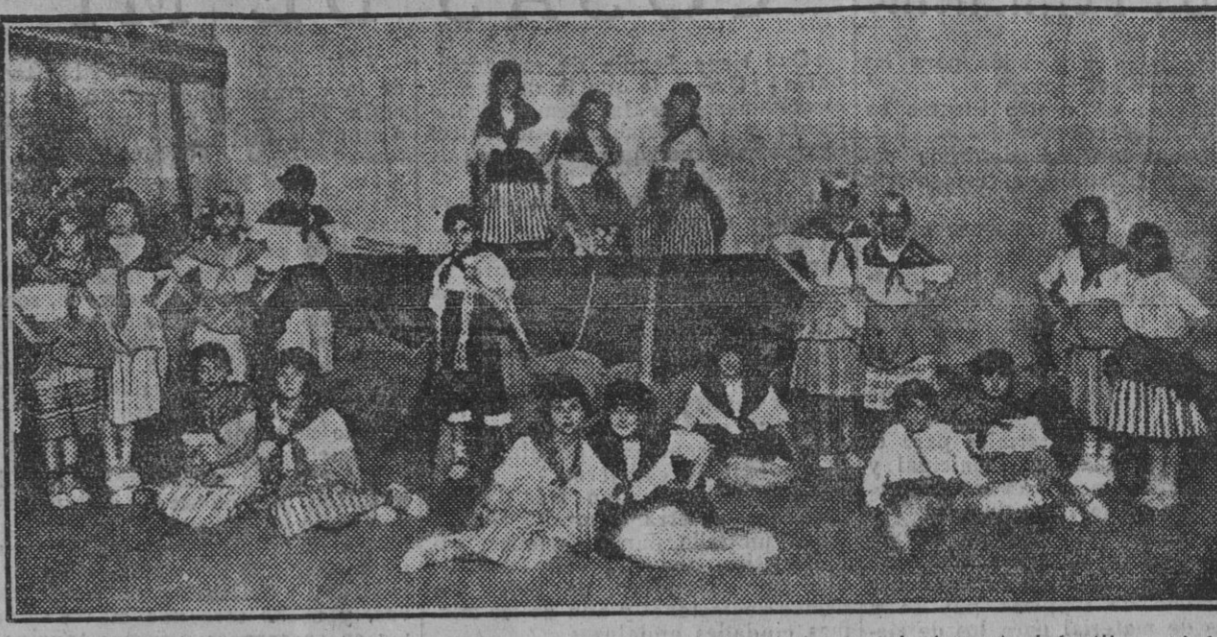
Una escena del apropiado estudio «A orillas del mar», representado por el elemento infantil en el festival celebrado anoche en el teatro San Fernando, con motivo del reparto de premios a los obreros. (Fdo. Gori.)

En Sevilla está tan agravado el problema de la vivienda porque los ensanches y el tiempo destruyen