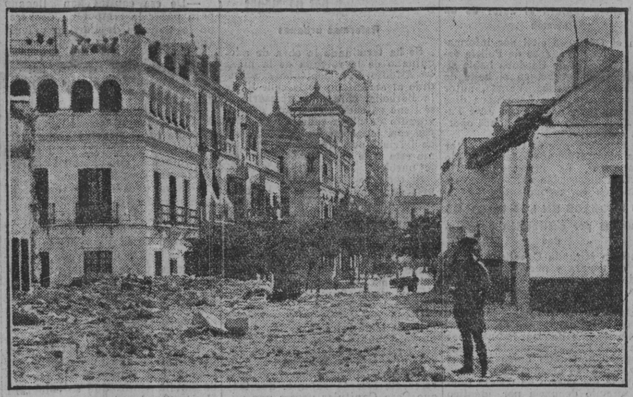
Una vista de la calle Canalejas desde el derribo del Cuartelillo de Milicias, que da acceso á la ciudad desde por la de Julio César.

Otro día, á mitad de una penosa jornada, hicimos un prolongado alto en sitio garantido en lo posible, y al pie de un abundoso arroyo, en el que se bañaron y se bañaron los que se bañaron. En esta marcha perdimos tres de estos últimos, con sus respectivas cargas, que, rendidos por el escabroso terreno, tendieron, sin que halagos ni castigos les hicieran levantar: fueron, al fin, abandonados, y pasarían seguramente á enriquecer el botín que de nosotros robaban los ifugaos, que tanamente nos perseguían.