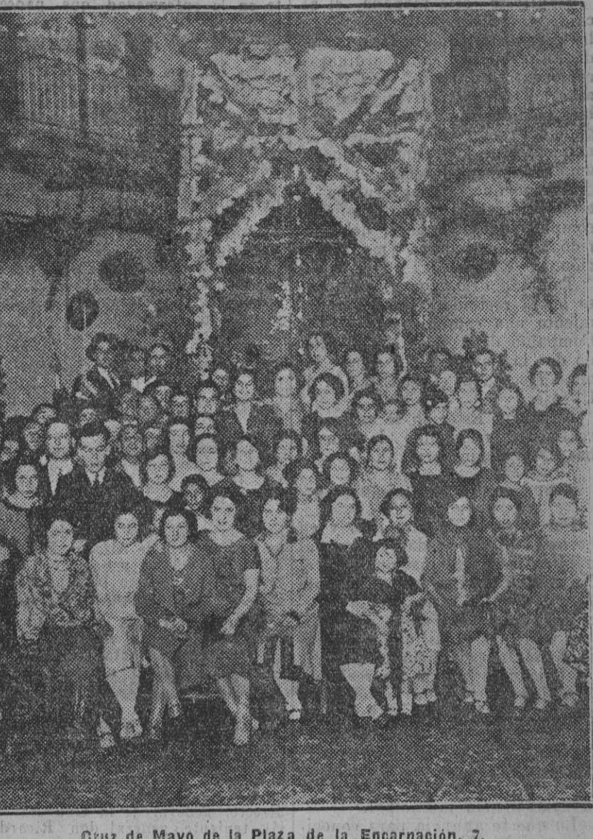
Cruz de Mayo de la Plaza de la Encarnación, 7.