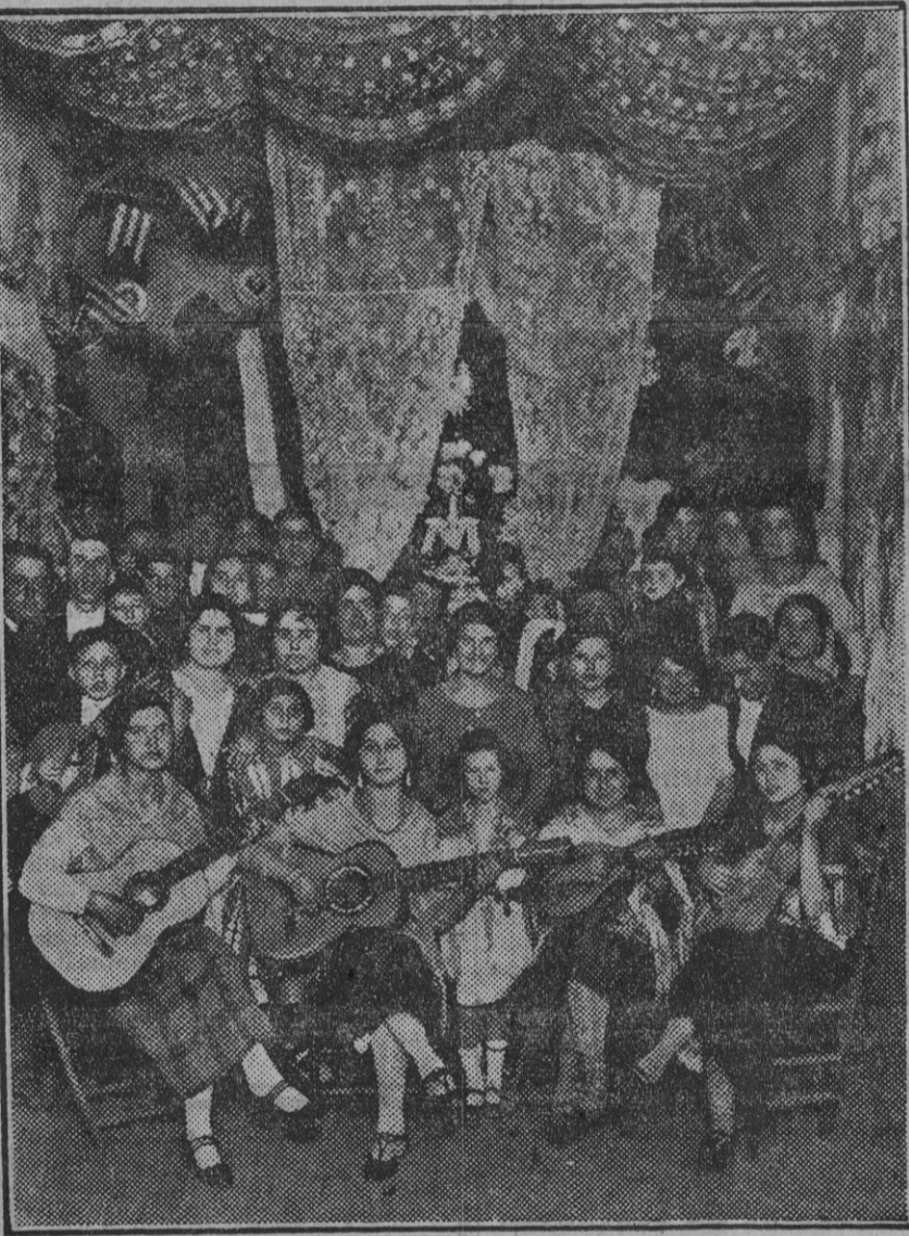
Cruz de Mayo de calle María Auxiliadora, 5.