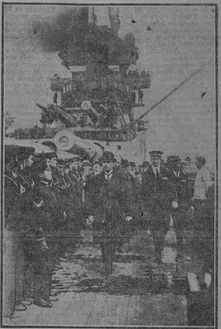
El «duce» Mussolini, a bordo del «Cavour», revistando a la marinería antes de partir con dirección a Trípoli. Esta es la primera fotografía obtenida del jefe del fascismo después del atentado.

Ese vapor italiano, dedicado al tráfico de carne humana viva procedente de las costas mediterráneas desde los puertos balcánicos hasta Gibraltar, ha arrojado, al mar, durante la travesía, los cadáveres de setenta criaturas que murieron a consecuencia de enfermedades producidas por el hacinamiento, la pésima alimenta-