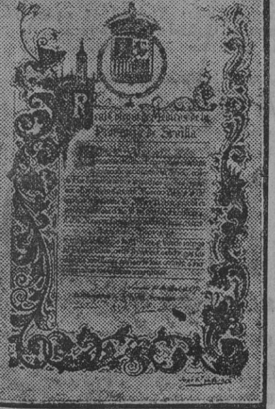
El pergamino que el Real Colegio de Médicos de la provincia de Sevilla ha entregado al médico del crucero «Buenos Aires», nombrándole presidente honorario de la citada institución.

De dicho trabajo entresacamos lo siguiente: Como médico y como marino argentino esta manifestación es para mí doblemente significativa. Como médico será uno más entre mis compañeros, que, agradecido, reconozco siempre la nobleza y gentileza que nuestros colegas de la vieja y querida Madre Patria ponen en todos los actos de acercamiento espiritual y científico con nosotros los argentinos. Ya existe un vínculo que no podrá jamás romperse; muy al contrario, se estrechará más y más para suerte nuestra, que podremos seguir disfrutando de las sabias lecciones de las eminencias médicas de España, enriqueciendo con ello nuestro caudal científico, necesario en la lucha que no termina nunca, en bien de la humanidad que sufre.