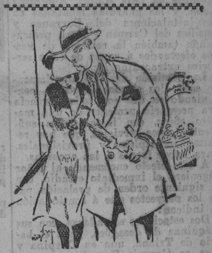
—Oh, bella Añicia: cuándo llegará el día en que pueda decir que eres mía para siempre... —Mañana mismo, si quieres. —No, mañana, no; que hay un partido de fútbol. (De Le Rire, de París.)

De todos modos el presidente Loeve es partidario de la total aplicación de la prohibición para los menores.