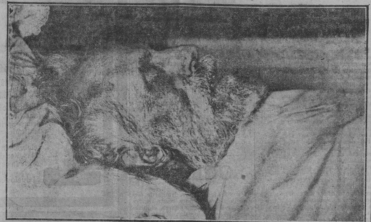
El cadáver del ilustre jefe del Socialismo, Pablo Iglesias, expuesto en la capilla ardiente.

Este partido ha despertado grandísimo interés en la afición por la brillante actuación de la Balompédica Linense ante el campeón de Andalucía.