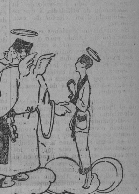
LA CONFUSION DE SEXO —Señor: ¿Dónde coloco este alma que acaba de llegar? ¿Don los bienaventurados...? ¿Don las bienaventuradas...? (De Le Rire, de París.)

El Príncipe de Asturias, que jurará el cargo de maestrante su alteza real el príncipe de Asturias.