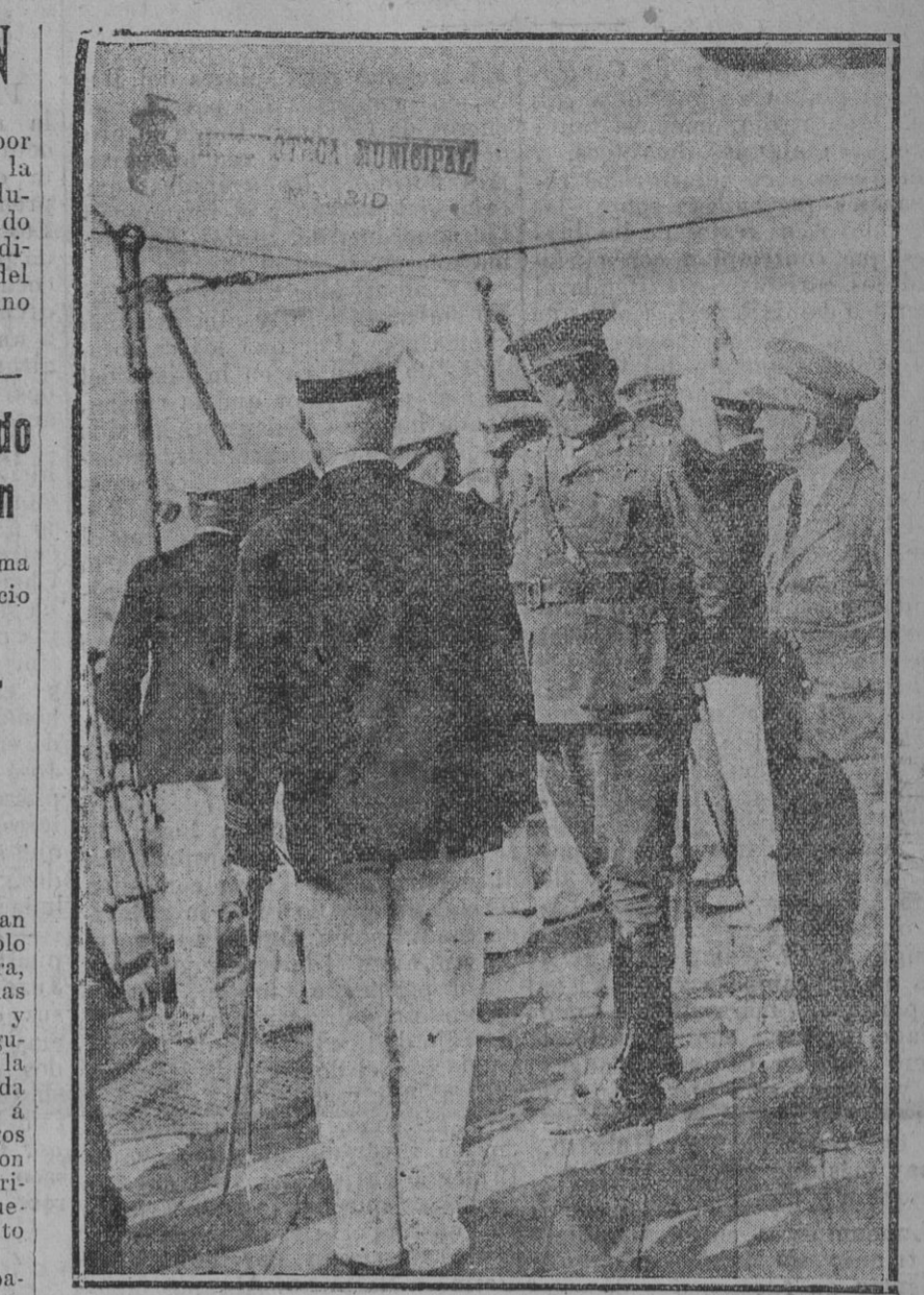
El general Primo de Rivera, á quien se ha concedido la gran cruz laureada de San Fernando, á su regreso á Ceuta y Tetuán.

El Diccionario de la Lengua Española que como decimoquinta edición del léxico castellano acaba de publicar la Academia Española, ha sido, como siempre ocurre, objeto de una serie de trabajos dedicados á comentarlos y á criticar las novedades que se introducen. Y, como siempre también, estos trabajos se leen con interés por un círculo bastante extenso de personas cultas, á veces quizá más por la forma en que sus autores se expresan que por el fondo de las teorías sustentadas. Que si hay quienes tratan de las cuestiones del lenguaje con toda mesura y discreción, no faltan algunos que toman pretexto de cualquier deslizo, inevitable en obra tan magna como la del Diccionario, para zaherir á la docta Corporación que lo redacta.