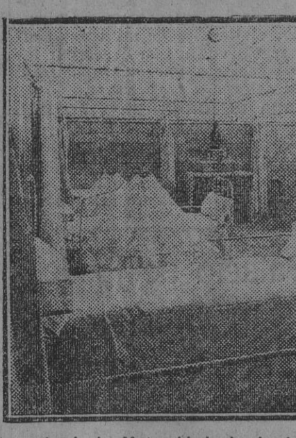
La sala de la Maternidad, donde dan a luz las madres pobres acogidas al padrón benéfico. Hay siete camas y siete cunillas para los niños recién nacidos.

parturienta vaya a dar a luz a la Maternidad. Unas vienen por sus pies, otras en carruaje, otras en una camilla, y aquí se las atiende en la sala de partos, donde, como usted ha visto, hay siete camas y siete cunillas para que descanse el crio. La instalación es admirable. —¿Se llevan aquí mucho tiempo? —Pocos días. Algunas dan a luz,