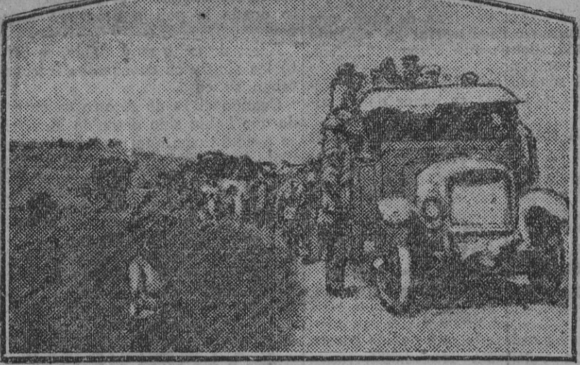
Uno de los convoyes automóviles que permiten a nuestros aliados el rápido transporte de tropas con el menor número posible de víctimas cuando arrecia la lluvia de balas enemigas. Foto Le Matin. Fdo. Gori.