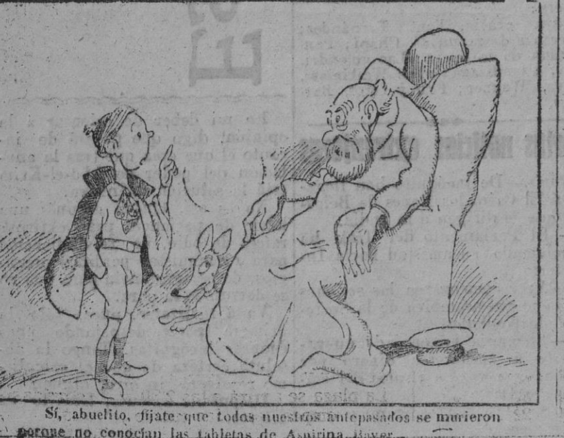
Si, abuelito, fíjate que todos nuestros antepasados se murieron porque no conocían las tablas de Aspinia-Bayer.