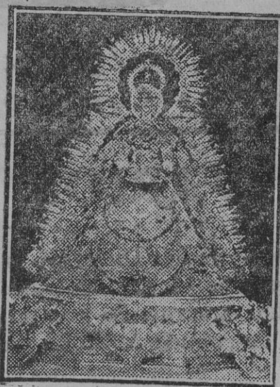
La peregrina imagen de Nuestra Señora de Gracia, Patrona de la ciudad de Carmona.