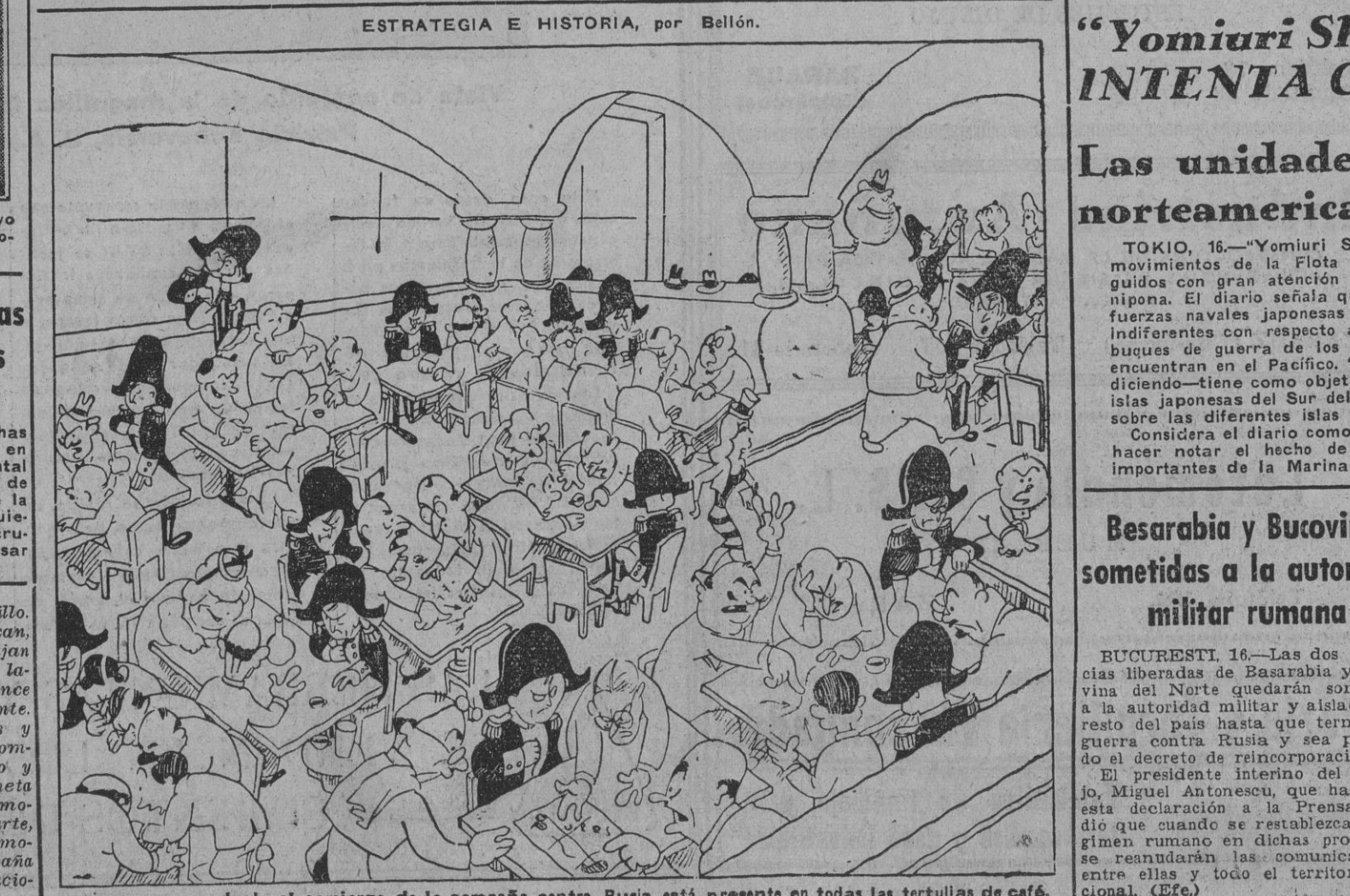
El personaje que desde el comienzo de la campaña contra Rusia está presente en todas las tertulias de café.

TOKIO, 16. (Urgente.)— El Gobierno japonés ha presentado la dimisión, según se anuncia oficialmente. (Efe.)