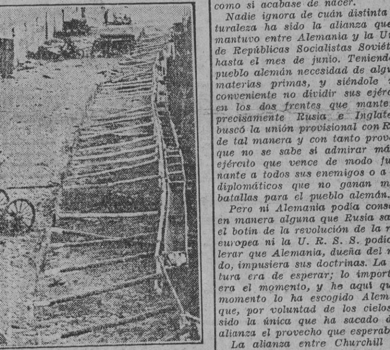
Después de la conquista de Brest-Litovsk los alemanes se apoderaron del fuerte del mismo nombre, donde vencieron la resistencia marxista. La foto reproduce una parte del fuerte en el estado en que quedó después de la ocupación.

CUARTEL GENERAL DEL FUHRER, 16.— El Alto Mando de las fuerzas alemanas comunicó: "Frente oriental: Las operaciones continúan desarrollándose favorablemente. Los contraataques del frente han sido rechazados con enormes pérdidas para el enemigo. En la lucha contra Inglaterra, la aviación alemana ha averiado gravemente a dos grandes mercantes al este de Newcastle. Durante la noche pasada, nuestros aviones de bombardero atacaron las instalaciones del puerto de Margate. El enemigo voló anoche sobre el Oeste de Alemania. Esta irrupción fue realizada por débiles formaciones aéreas, que no lanzaron más que un pequeño número de bombas explosivas e incendiarias. Los cazas nocturnos derribaron tres aviones de bombardero británicos. Como ya ha sido anunciado en un comunicado especial, el teniente coronel Moellers, jefe de una escuadra de caza, derribó ayer otros cinco aviones soviéticos, alcanzando su 101 victoria aérea desde el comienzo de la guerra." (Efe.)