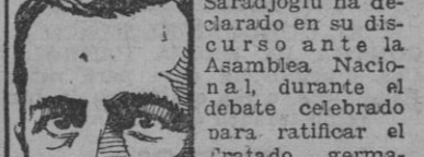
FRIVOLOS, por Bellón

El "Boletín Oficial del Estado" publica hoy una ley por la que se autoriza la emisión de Deuda pública por valor de 2.000 millones de pesetas. La Deuda que se emite será Deuda Perpetua interior, al tipo de interés del 4 por 100 anual y al tipo de emisión del 90 por 100. La suscripción se abrirá el día 5 de julio, y las cantidades que se solicitan serán prorrateables. Esta emisión, según dice la ley, va a atender necesidades del presupuesto extraordinario. En los mercados, la noticia, que se presentó hace mucho tiempo, ha sido acogida con todo interés. Desde hacía mucho tiempo se ha apreciado una falta de papel en esta clase de Deuda, e indudablemente la demanda será muy superior a esta oferta limitada de 2.000 millones.