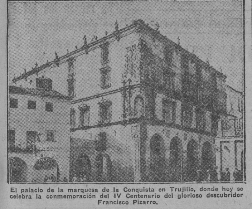
El palacio de la marquesa de la Conquista en Trujillo, donde hoy se celebra la conmemoración del IV Centenario del glorioso descubridor Francisco Pizarro.

Por la noche, el regimiento de Urgel y su Plana Mayor hacían solemne entrega de la bandera de su Arma en la escalinata del Ayuntamiento al alcalde de la ciudad, y momentos después lo hacía también la Infantería de Marina de la base naval de San Fernando. El acto, que resultó de una intensa emoción, fué presenciado por el numeroso público estacionado frente al palacio municipal. Los vivos a España, a Franco y a Francisco Pizarro se sucedían sin interrupción. La ciudad de Trujillo, por la noche, presentaba una completa iluminación, especialmente el Santuario de la Virgen de la Victoria, Patrona de la ciudad, encavado en lo más alto de la población. A última hora llegó también una representación del S. E. U. nacional, y en unión del Frente de Juventudes de Trujillo, celebraron en estrecha colaboración un acto de exaltación históricoespiritual dedicado a la memoria y obra del conquistador español.