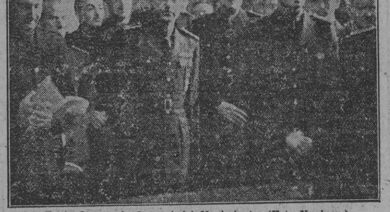
En la Secretaría General del Movimiento.