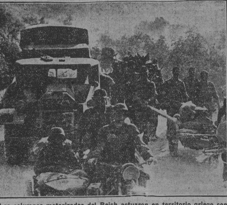
Las columnas motorizadas del Reich actuaron en territorio griego con la misma eficacia y rapidez que anteriormente lo habían hecho en el Oeste de Europa...