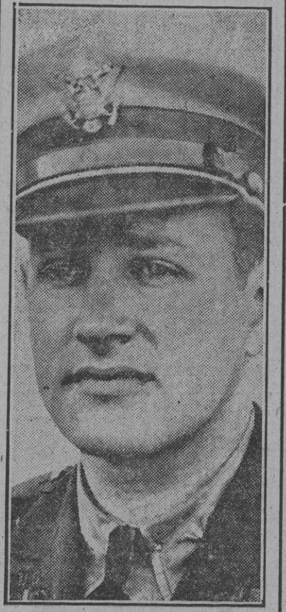
El agregado militar de la Embajada de Estados Unidos en Italia, cuya salida de Roma fué pedida a Washington a raíz de la orden norteamericana de incautación sobre los barcos del Eje y los incidentes a que dió lugar.