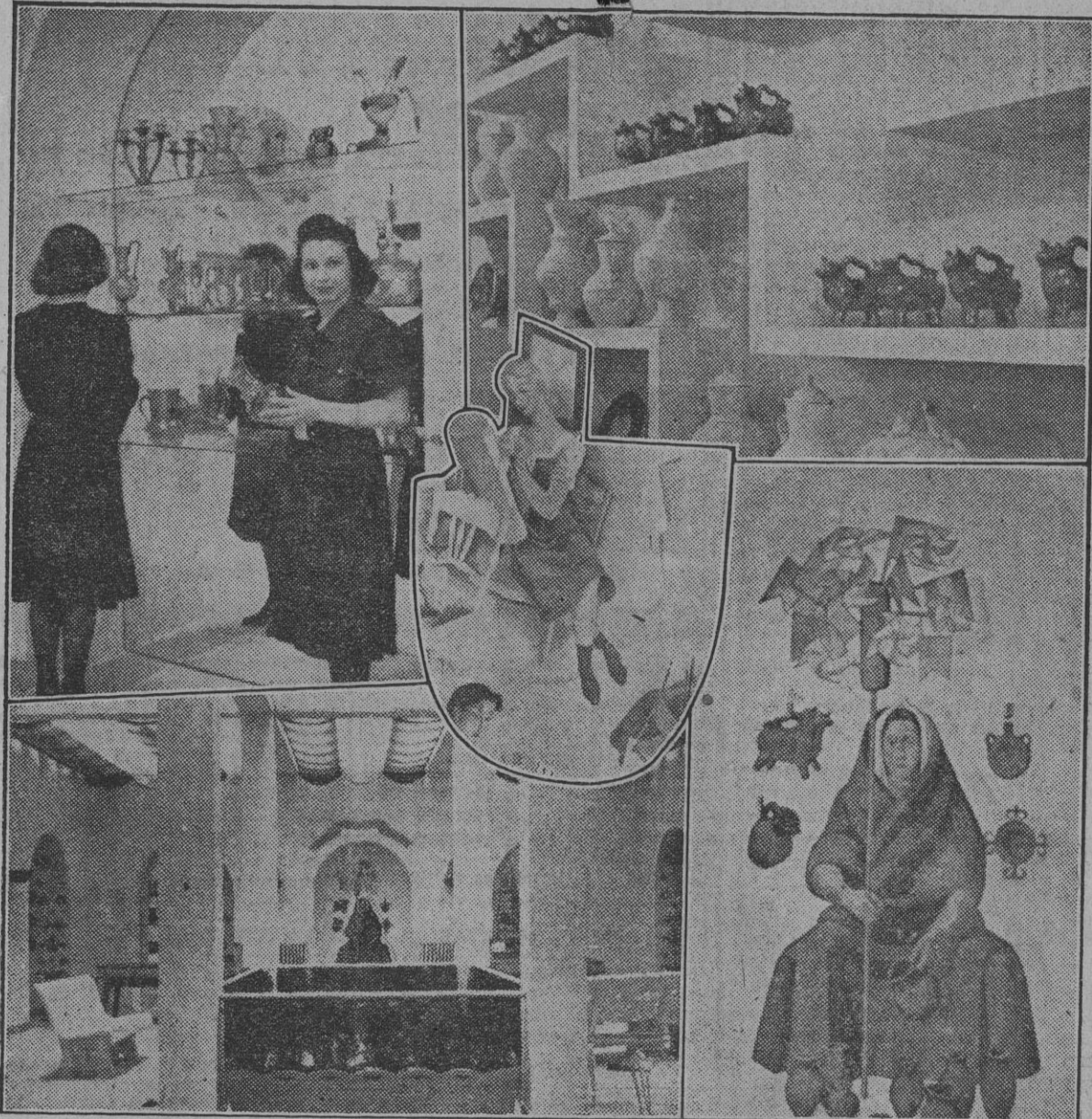
Diversos aspectos del Mercado de Artesanía, que será inaugurado mañana, en la calle de Floridablanca, 1, debido al esfuerzo de la Delegación Nacional de Sindicatos.

Asistirán representantes del artesanado alemán, italiano y portugués DURANTE DIEZ DIAS SE MANTENDRÁ COMO EXPOSICIÓN