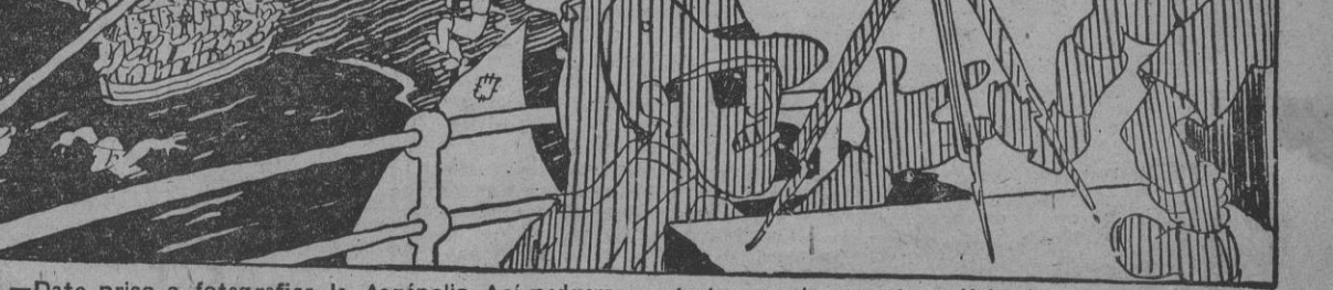
—Date prisa a fotografiar la Acrópolis. Así podremos entretener a los nuestros diciéndoles que estas ruinas son obra de los Stukas... ENGANIFAS DEMOCRATICAS, por Bellón.

ANGORA, 25.—Los ingleses se proponen desembarcar un contingente de 4.000 hombres en Basora, según comunican de Bagdad. (Efe.)