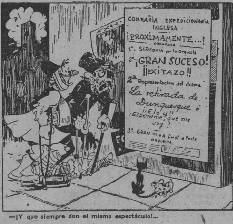
—Y que siempre den el mismo espectáculo!...

La Cámara búlgara aplaza sus sesiones SOFIA, 12.—La Cámara ha aplazado sus sesiones hasta después de Pascua. (Efe.)