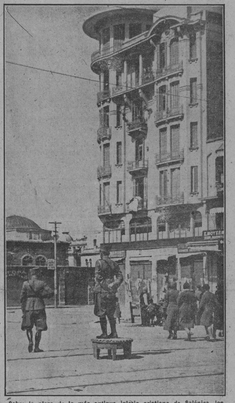
Sobre la plaza de la más antigua Iglesia cristiana de Salónica, los guardias dirigen el tráfico.

SE CREA EL ESTADO CROATA El ejército del Sur de Serbia HA SIDO ANIQUILADO Los ingleses cortaron la retirada a los griegos que capitulan en el Vardar Simovich aconseja la resistencia