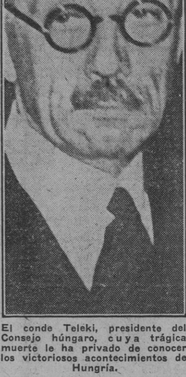
El conde Teleki, presidente del Consejo húngaro, cuya trágica muerte le ha privado de conocer los victoriosos acontecimientos de Hungría.

La ciudad de Zagreb, ocupada SE CREA EL ESTADO CROATA El ejército del Sur de Serbia HA SIDO ANIQUILADO Los ingleses cortaron la retirada a los griegos que capitulan en el Vardar Simovich aconseja la resistencia